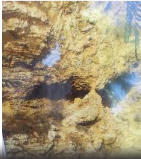
Inilah Bukit Tengkorak yang Sesungguhnya. Katholik Menetapkan Yesus Disalibkan di Dalam Tembok Yerusalem.