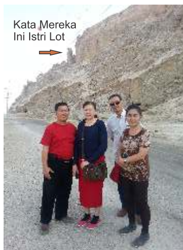
Kata Mereka Ini Istri Lot

Sehubungan dengan sistem ibadah simbolistik ritualistik lahiriah maka ada tempat yang kudus dan ada tanah yang kudus dan lain sebagainya yang bersifat materi dan lahiriah. Sehubungan dengan janji Juruselamat pula maka orang Yahudi yang terpencar harus datang kembali ke Yerusalem untuk melaksanakan tiga upacara penting yaitu perayaan Paskah, Pentakosta, dan Pondok Daun.