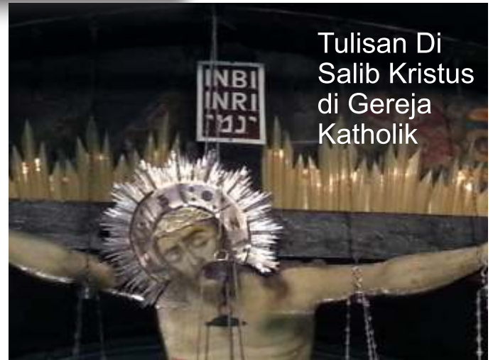
Tulisan Di Salib Kristus di Gereja Katholik