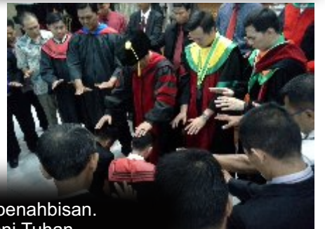
Puncak acara Kongres Fundamentalis yaitu Wisuda GITS & penahbisan. Kiranya makin banyak orang yang terpenggil untuk melayani Tuhan