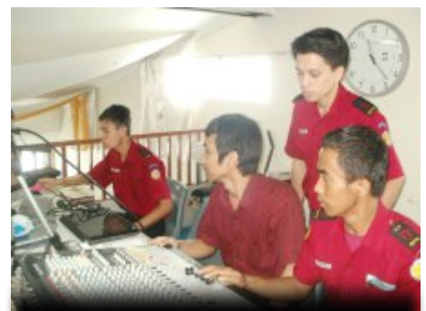
Di balik layar kesuksesan kongres

Jadi, kesimpulan kita ialah bahwa karunia melakukan mujizat yang diberikan Tuhan kepada para Rasul adalah untuk mendukung mereka menyampaikan firman Tuhan dan menuliskannya. Setelah Alkitab selesai ditulis, oleh Rasul yang terakhir yaitu Yohanes, maka karunia melakukan mujizat tidak diberikan lagi, dan wahyu juga tidak diturunkan lagi. Siapapun yang di kemudian hari berkata bahwa ia mendapatkan wahyu atau bernubuat tentang sesuatu, misalnya seseorang akan menjadi Presiden di sebuah negara, maka semua itu adalah bohong, bahkan sangat mungkin mereka adalah anak buah Lucifer.*