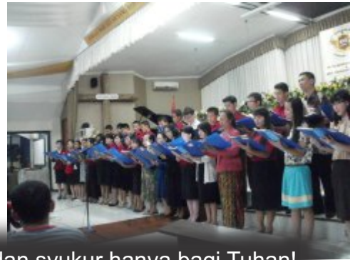
Kesaksian dari berbagai komisi dan GBIA lainnya. Segala puji dan syukur hanya bagi Tuhan!