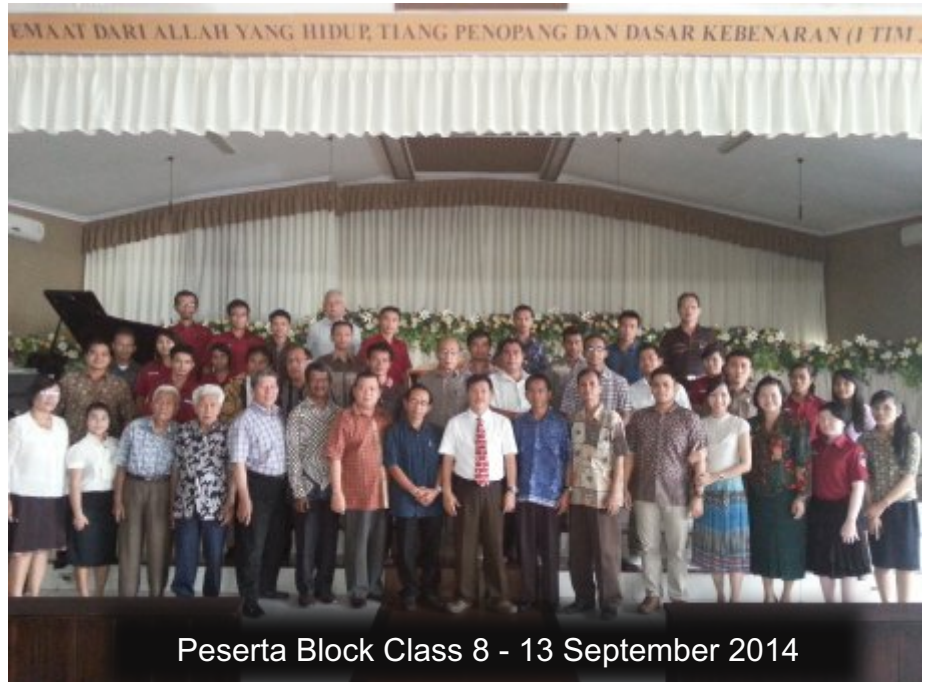
Peserta Block Class 8 - 13 September 2014

GITS bangga bisa menghasilkan Doktor Theologi dengan mutu yang sedemikian rupa, yang akan memberikan sumbangsih yang sangat berarti bagi dunia theologi terutama yang berjuang untuk theologi yang benar.***