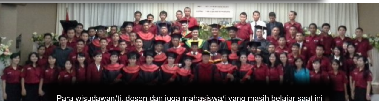
Para wisudawan/ti, dosen dan juga mahasiswa/i yang masih belajar saat ini