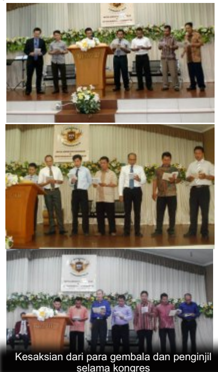
Kesaksian dari para gembala dan penginjil selama kongres

Saya sungguh heran melihat banyak orang yang disebut ahli hukum, dan mengerti hukum, namun menjadi pengikut nabi-nabi palsu. Sehingga saya berpikir benarkah mereka mengerti hukum? Mengapakah mereka tidak bisa mengerti hukum Allah? Mudah-mudahan tulisan ini akan menerangi pikiran mereka. ***