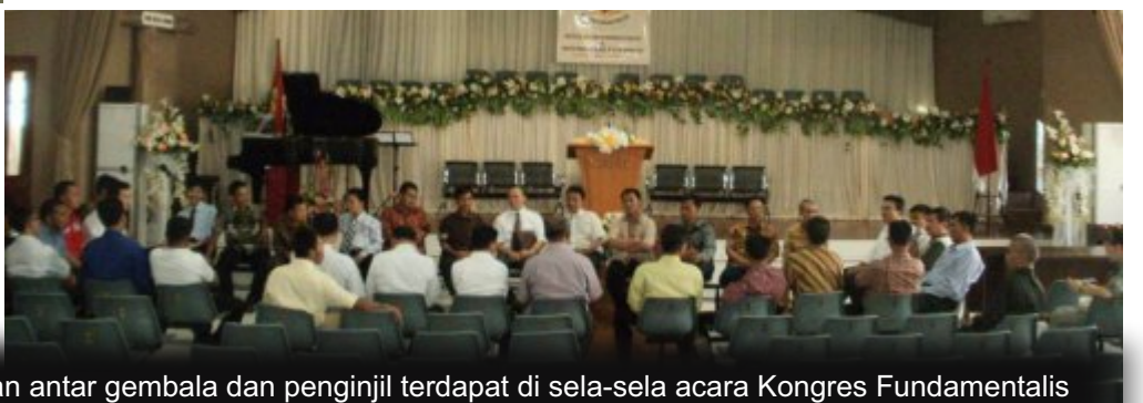
Sidang penahbisan serta pertemuan antar gembala dan penginjil terdapat di sela-sela acara Kongres Fundamentalis