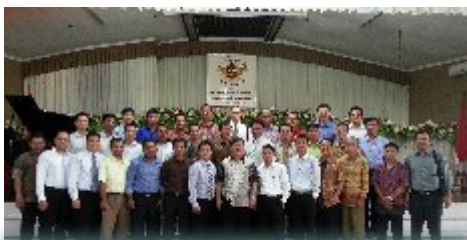
Gembala & Penginjil Yang Menghadiri Acara Kongres