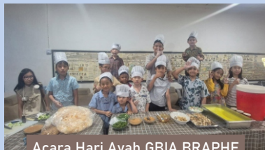
Acara Hari Ayah GBIA BRAPHE