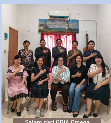
Salam dari GBIA Omega