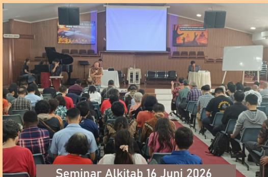
Seminar Alkitab 16 Juni 2026