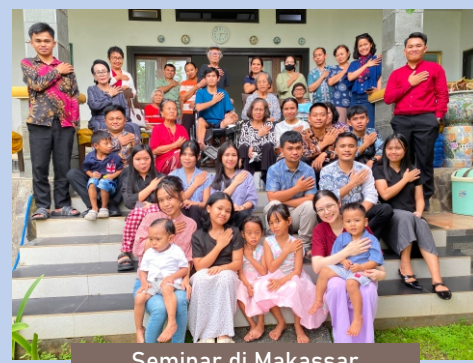
Seminar di Makassar