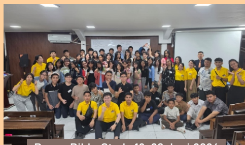
Berea Bible Study 19-20 Juni 2026

Yayasan Peka (Pelaksana Kasih Allah) BCA Sunter Mall A/C 007-36-3131-6 Bank Mandiri A/C 120-009-8080-786