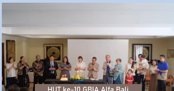
HUT ke-10 GBIA Alfa Bali