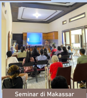
Seminar di Makassar