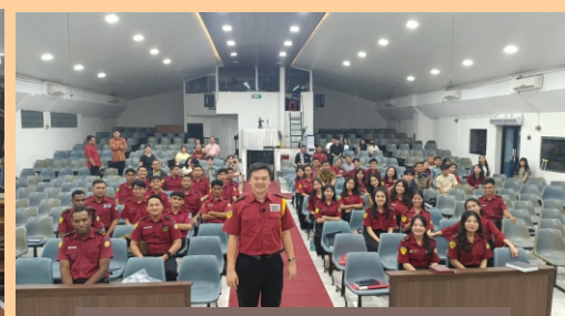
Acara Penutupan Semester GITS