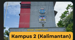
Kampus 2 (Kalimantan)