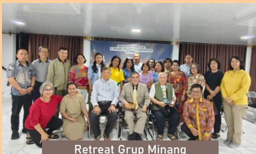
Retreat Grup Minang

Sekarang, jika Anda sungguh mengerti kebenaran, namun tidak bersemangat atau semangat kamu kalah dari semangat anak-anak Iblis, maka ingatlah bahwa Anda punya andil terhadap kemunduran Kekristenan di wilayah Anda dan di muka bumi. Seandainya Anda masuk Sorga, maka Anda akan sangat malu di hadapan Tuhan, serta dengungan suara tuduhan akan mengejar Anda, bahwa Anda sebagai seorang yang mengerti kebenaran, seharusnya bisa bersemangat mengumandangkan Kebenaran yang Anda ketahui sehingga lebih banyak orang diselamatkan.***