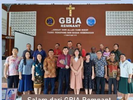
Salam dari GBIA Remnant