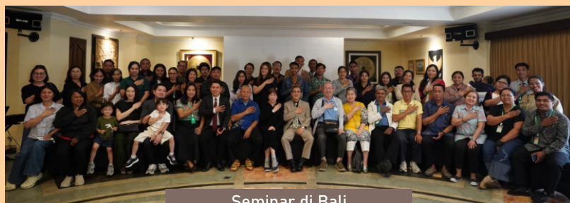
Seminar di Bali

Pertanyaan yang sangat penting adalah, sungguhkah pembaca paham tentang doktrin yang benar, yang sungguh-sungguh sesuai Alkitab? Jika belum sebaiknya jangan bersemangat dan jangan bergiat dahulu, karena