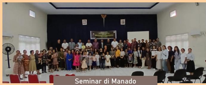
Seminar di Manado