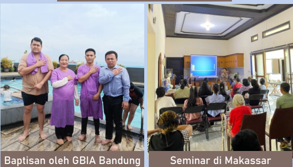
Baptisan oleh GBIA Bandung