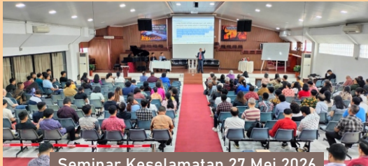
Seminar Keselamatan 27 Mei 2026