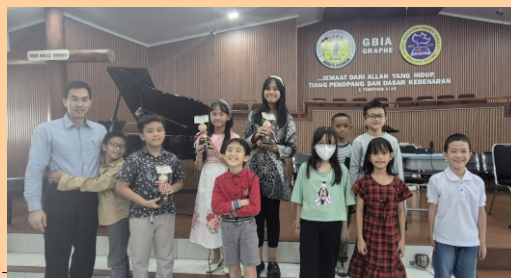
Lomba Cerdas Cermat Alkitab Kids