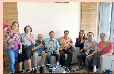
Salam dari GBIA Eleos