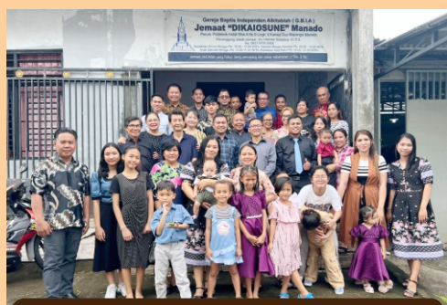
Kebaktian gabungan se-Sulut