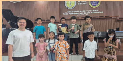
Lomba Cerdas Cermat Alkitab Kids