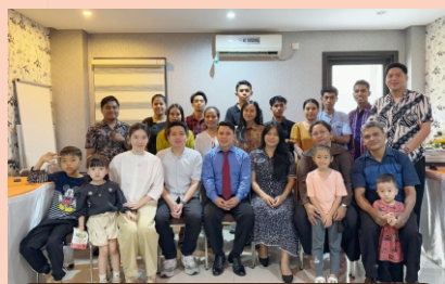
Salam dari GBIA Denpasar Bali

Jika Anda ingin terangkat pada saat bunyi sangkakala, atau dibangkitkan karena sudah mati duluan, maka bertobatlah dari dosa dan ketidakpercayaan, kemudian percayalah bahwa Yesus Kristus telah dihukumkan menggantikan Anda. Kemudian, karena sangkakala belum berbunyi maka carilah gereja yang alkitabiah, agar iman Anda bertumbuh sesuai Alkitab dan penantian Anda tidak sia-sia. Maranatha.*