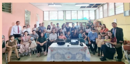
Salam dari GBIA Bandung