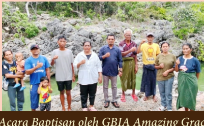
Acara Baptisan oleh GBIA Amazing Grace