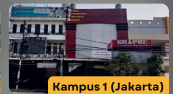
Kampus 1 (Jakarta)