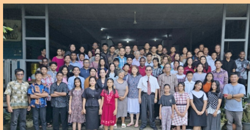
Block Class di RBC Ambawang tgl 16-18 Sep