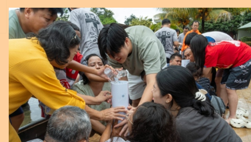
Lomba Kekompakan SRC 2024