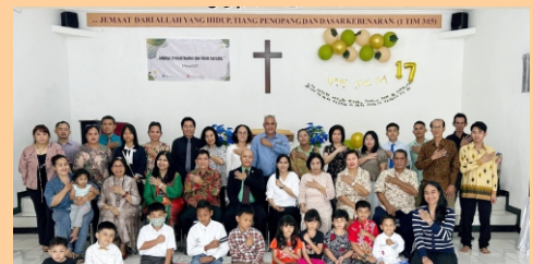
Salam dari GBIA Depok