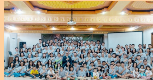
Spiritual Refreshing Camp 2024