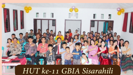
HUT ke-11 GBIA Sisarahili