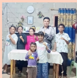
GBIA Verbum Dei Atambua