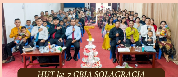
HUT ke-7 GBIA SOLAGRACIA