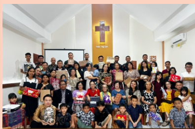
Acara Tutup Tahun GBIA Sintang