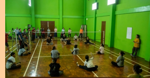
Lomba Voliminton SRC 2024