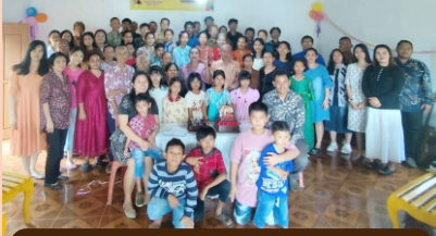
Salam dari GBIA Jayaguna Lampung