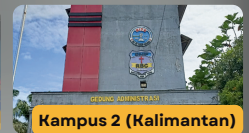
Kampus 2 (Kalimantan)