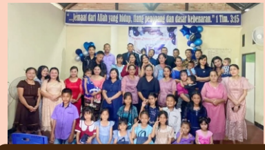
Acara Tutup Tahun GBIA Agape Pekanbaru