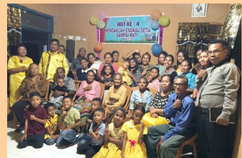
HUT ke-4 GBIA Mercy SOE