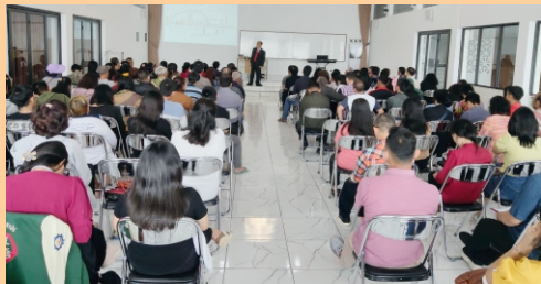
Block Class RAC Bandung tgl 26-28 Des