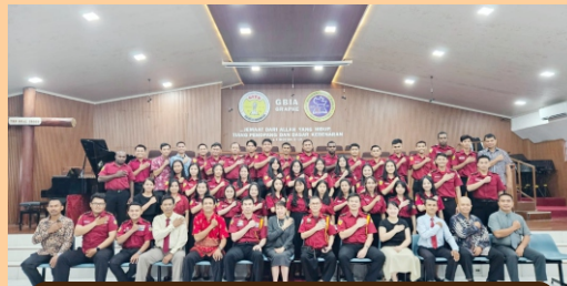
Mahasiswa/i GITS beserta dosen