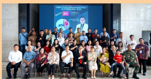
Seminar di Aula Korem Bogor