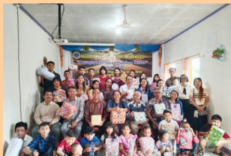
Kebaktian Tahun Baru GBIA Anugerah

Karena telah memakai sistem Demokrasi, berbagai tingkatan jabatan pemerintahan dipilih oleh rakyat, maka sangat baik bagi orang Kristen jika ia bisa terpilih dan menduduki jabatan-jabatan penting dan berpengaruh di pemerintahan. Dengan hadirnya orang Kristen di berbagai jenjang jabatan dan berbagai bidang; baik Eksekutif, Legislatif maupun Yudikatif, maka orang Kristen tersebut bisa ikut menjaga kebebasan pemberitaan Injil, dan kebebasan pendirian Jemaat Tuhan terus sampai Tuhan datang. Namun harus dicamkan, bahwa gereja tidak boleh tergiur akan kekuasaan duniawi, gereja tidak boleh melacurkan diri dengan kekuasaan duniawi