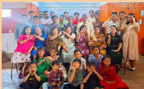
Salam dari GBIA Kasih Karunia