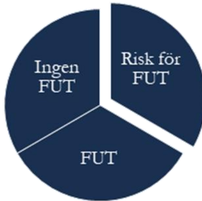
Figur 11.1 Fördelning av populationen i tre grupper