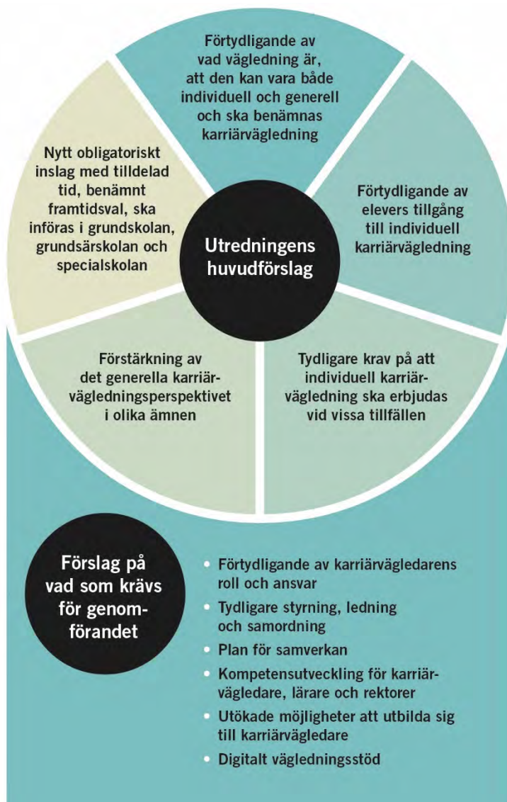
Figur 10.1 Utredningens huvudförslag och förslag på vad som krävs för genomförandet