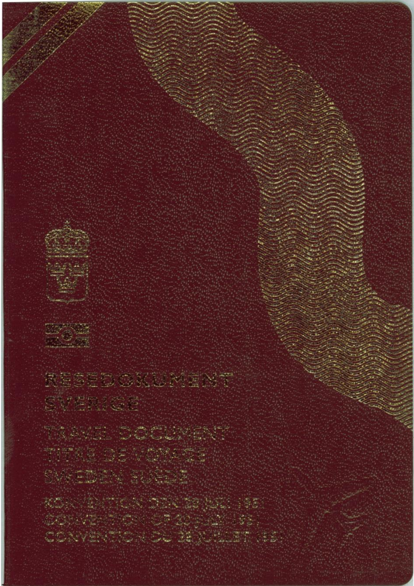
Figur 1 Resedokument