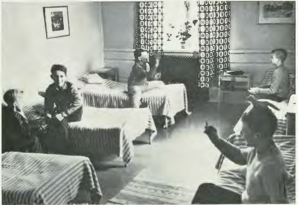
Sovrum vid upptagningskolan för döva & Manilla, Stockholm