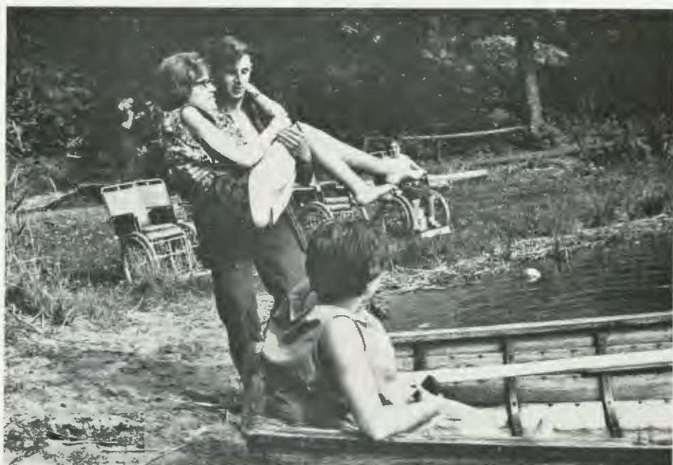
Från DVR:s läger för handikappade vid Aspvik