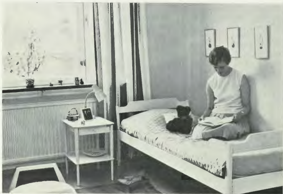
och ett barnhem i Stockholm