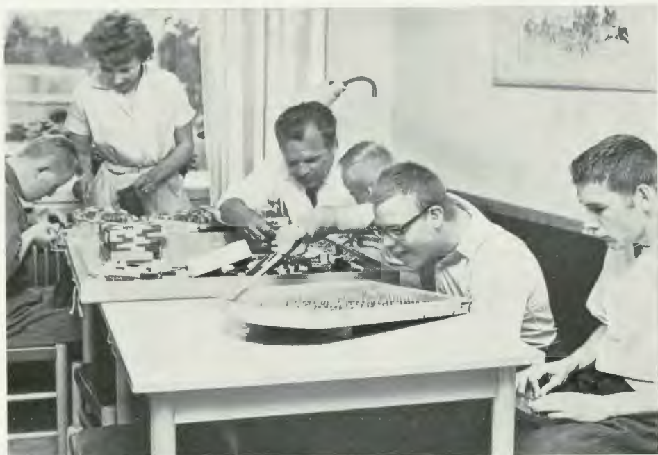
Fritidssysselsättning och sjukgymnastik vid Carlslunds vårdhem för psykiskt efterblivna, Upplands Väsby