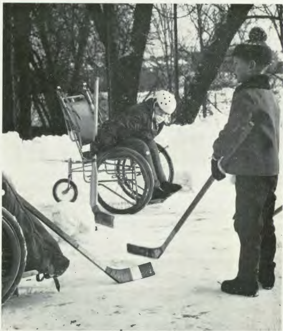
Från fritidssysselsättningen vid Eugeniahemmet