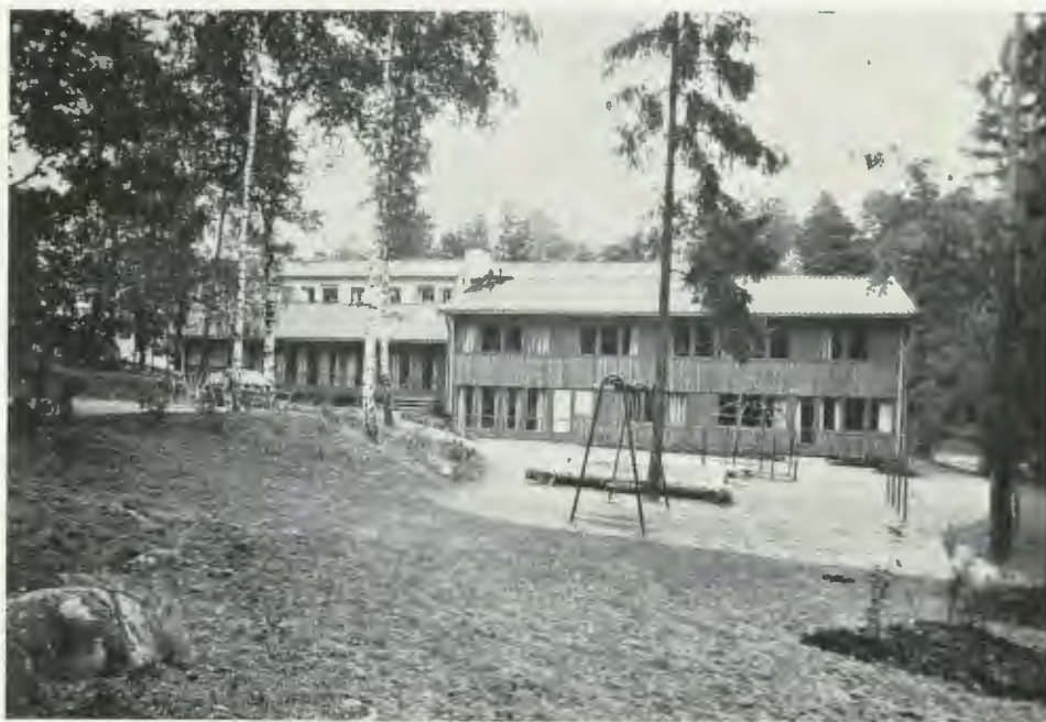
Barnhemmet Mälarblick i Stockholm