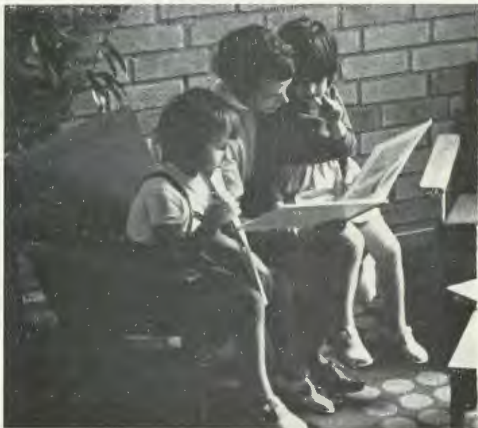
Sagostund vid barnhemmet Mälarblick, Stockholm