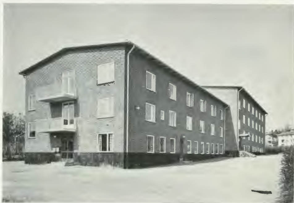
Upptagningskolan för döva i Härnösand