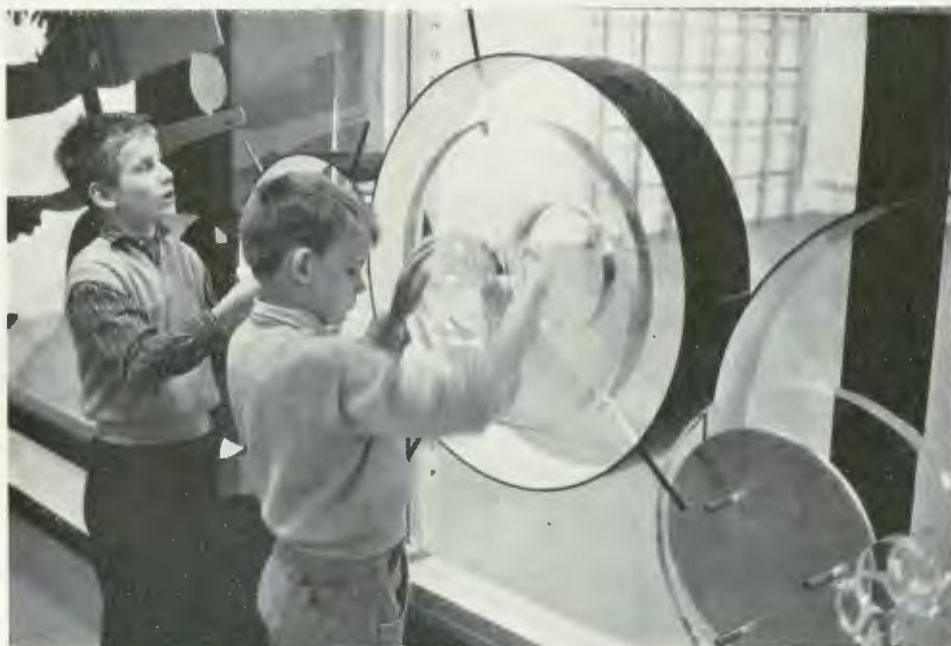
Från den pedagogiska verksamheten vid blindinstitutet å Tomtebodå i Solna och