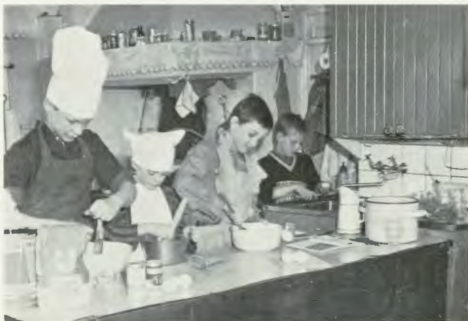
Köksbestyr vid Dormsjöskolans läkepedagogiska institut, Stjärnsund