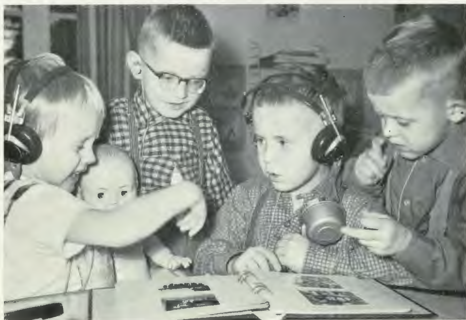
förskolan för döva och hörselskadade barn i Boden