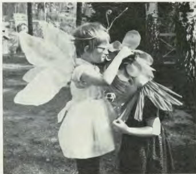
Sagospel vid Gerdahemmet i Äby, förskola för blinda barn