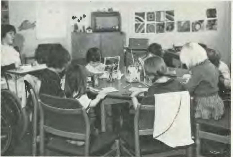
Lekgrupp vid Eugeniahemmet, Stockholm