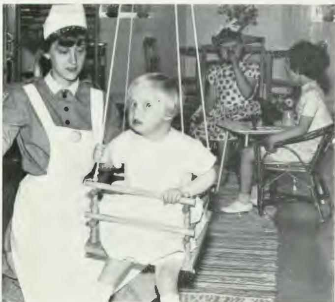
Kristinahemmet för psykiskt efterblivna barn i Askersund