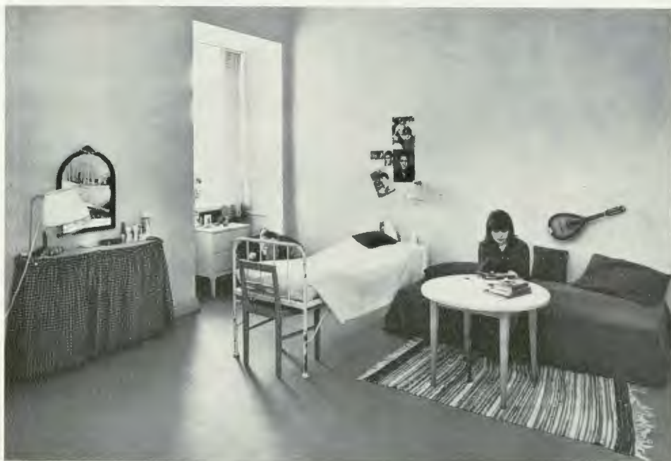
Sovruminteriör från vanföreanstalten i Härnösand