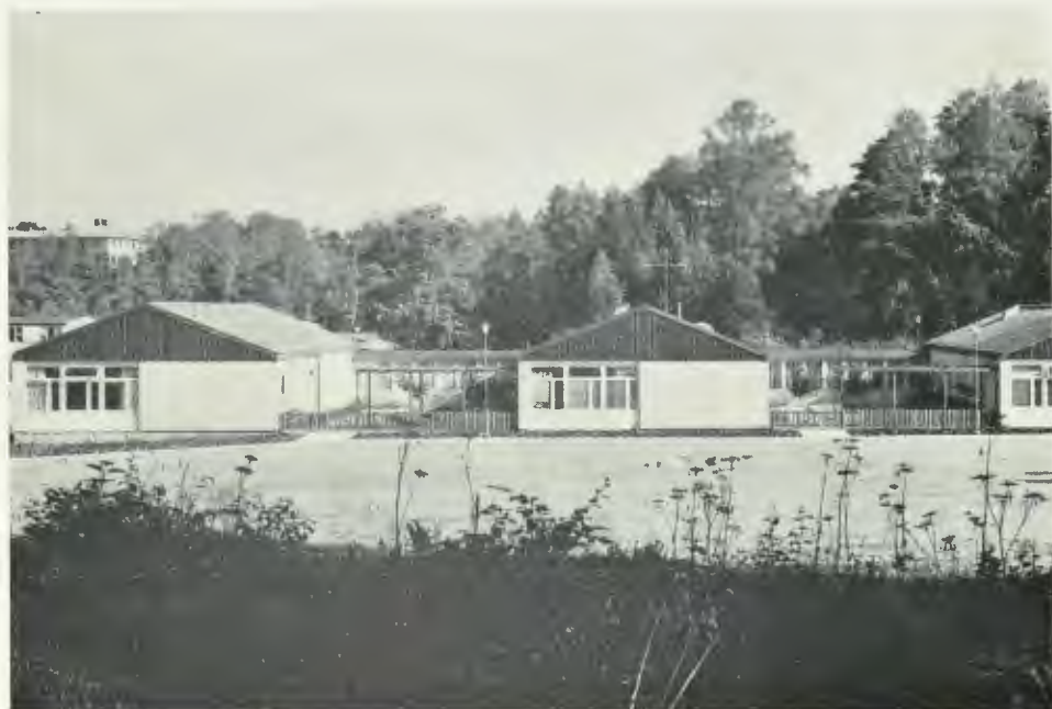
Sagåsens vårdhem för psykiskt efterblivna i Göteborgs och Bohus län