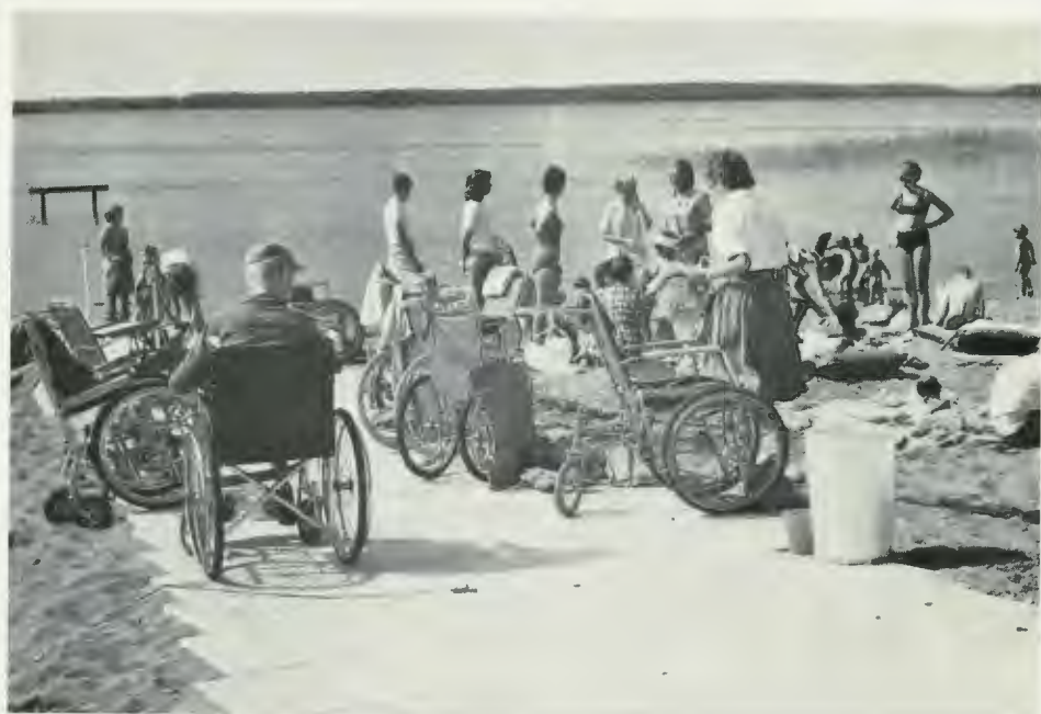
Från korttidsvistelse för psykiskt efterblivna rörelsehindrade barn vid Stiftelsen Solstrimmans koloni i Östa