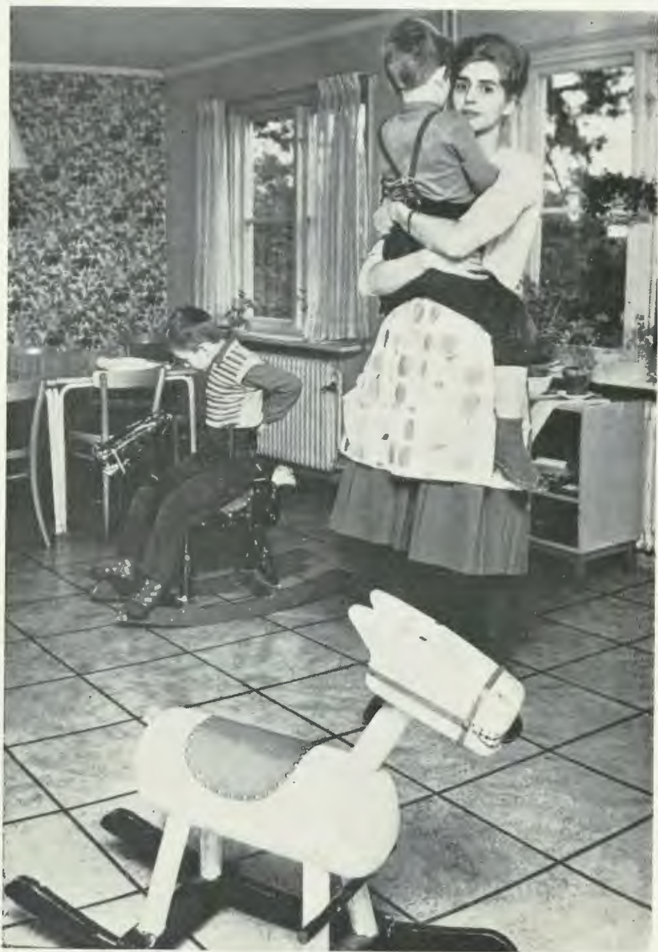
Barn och vårdare vid Barnbyn Skå