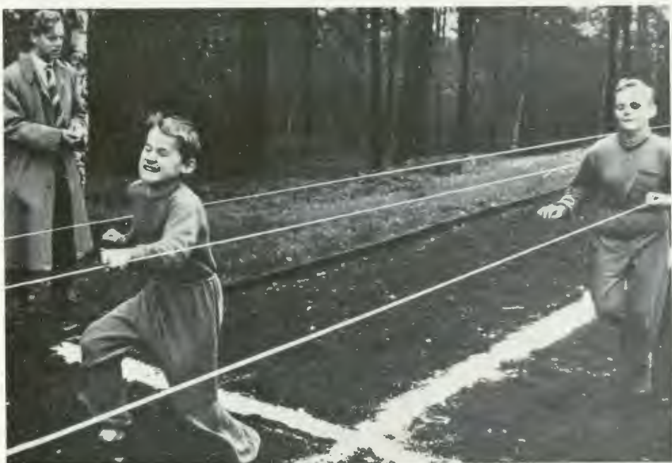
Idrott för blinda