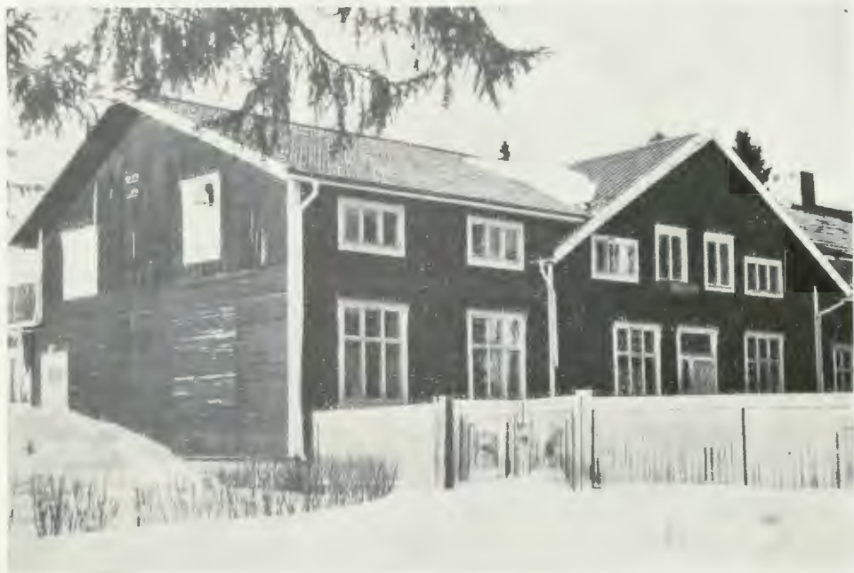
Norsjö vårdhem för psykiskt efterblivna i Västerbottens län