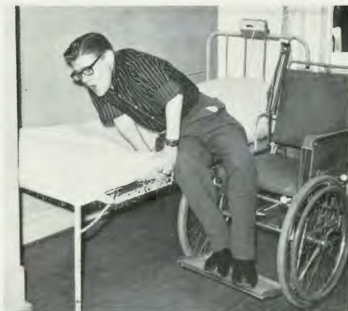
Från Sköldenborgsinstitutet i Hälsingborg