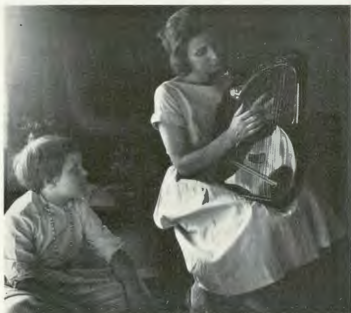
Från verksamheten vid Dormsjöskolan