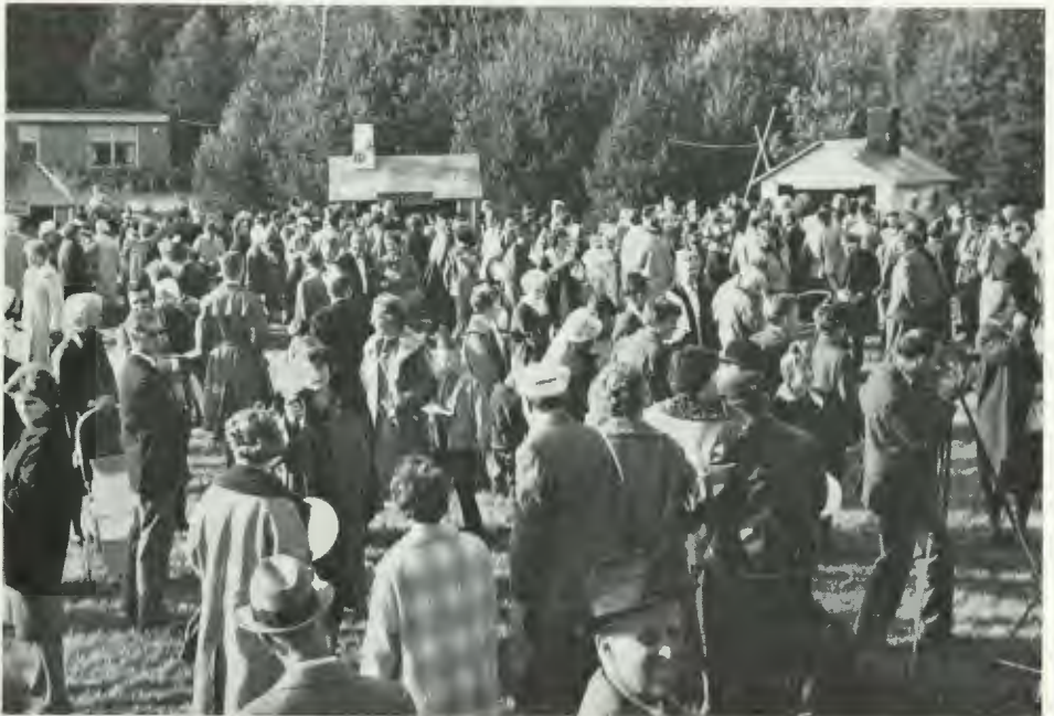
Barnens dagsfirande vid Carlslunds vårdhem för psykiskt efterblivna, Upplands Väsby