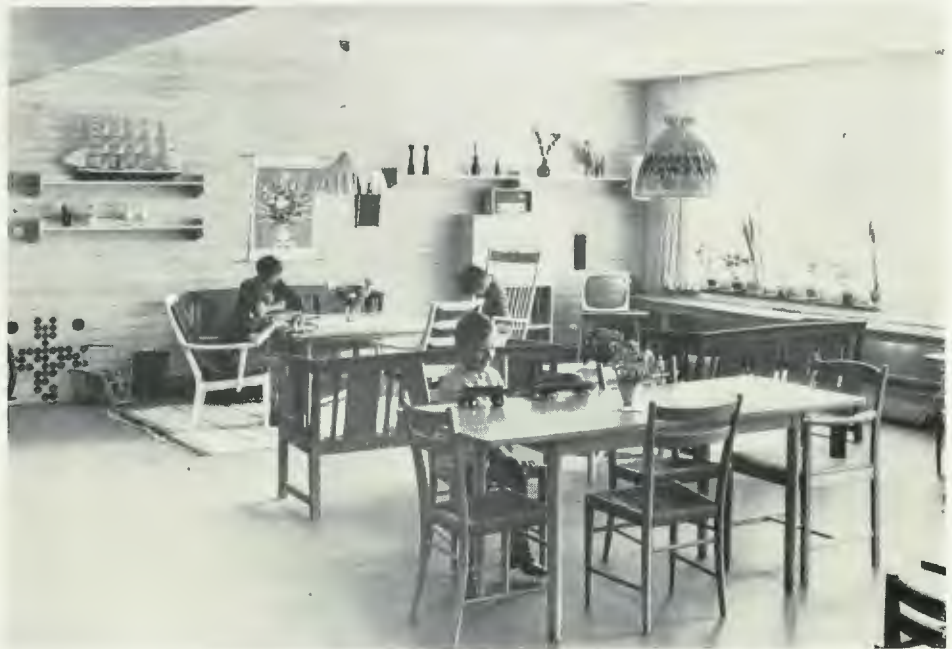
Dagrum vid Bräcke Östergård, Göteborg