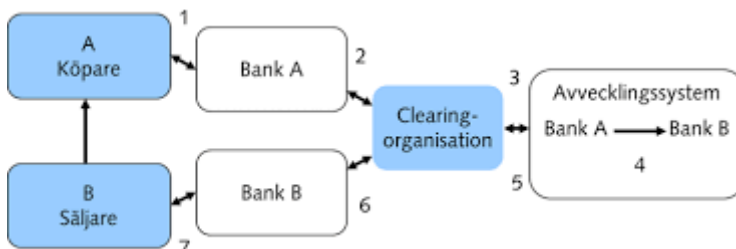
Bild 2. Exempel på betalning med flera mellanhänder

Ofta har dock den som ska betala och betalningsmottagaren inte konto i samma bank. Betalningsförmedlingen blir då mer komplicerad eftersom fler aktörer måste involveras och det krävs ytterligare finansiell infrastruktur för att förmedla information om transaktionen mellan parterna. I bild 2 initierar köparen betalningen genom att instruera sin bank att föra över ett belopp till säljaren (1). Bank A måste nu föra över pengar till bank B. Vanligtvis sker informationsutväxlingen mellan bankerna genom en så kallad clearingorganisation som behandlar informationen och förmedlar den mellan bankerna. Bank A sänder därför betalningsinformation till clearingorganisationen (2). Detta underlättar för bankerna eftersom de förmedlar ett stort antal betalningar och annars skulle behöva utväxla information med ett stort antal aktörer. När informationen behandlats sänds instruktioner till ett avvecklingssystem där bägge bankerna har konton (3) att föra över det överenskomna beloppet från köparens bank till säljarens bank (4). En bekräftelse på överföringen sänds till säljarens bank via clearingorganisationen (5, 6) varefter säljarens bank krediterar säljarens konto och meddelar denna att pengarna mottagits (7).