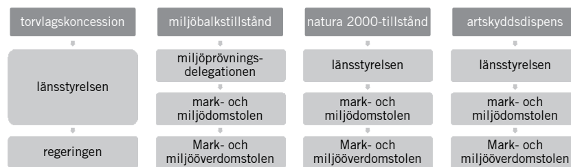
Figur 2. Instansordning för olika prövningar med koppling till torvtäkt