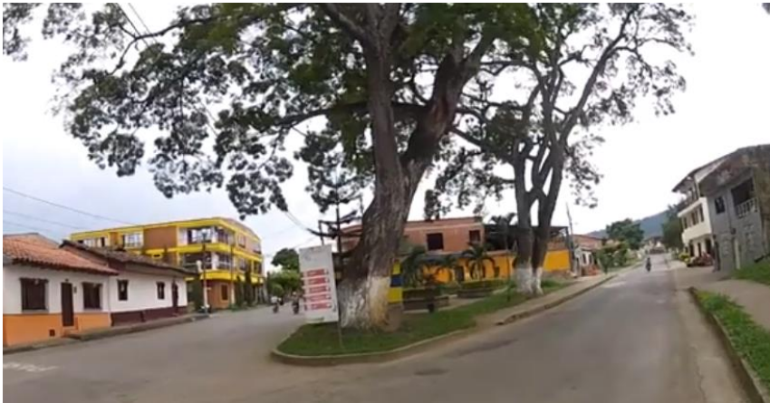
Túnel de los Samanes. En Viterbo - Destino Caldas y Primeras calles entrando al poblado, en Tour en moto de Jairo Cruz.