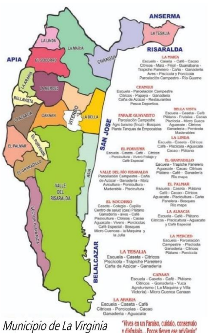
Cuenca del Risaralda y Veredas de La Virginia. Carder y Consorcio Ordenamiento Río Risaralda.