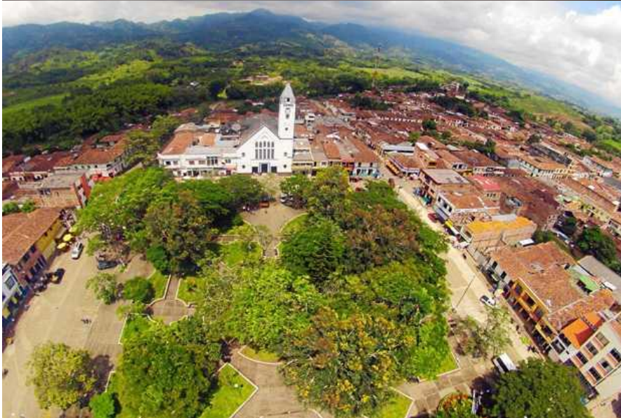
Viterbo-Caldas; y Panorámica de la Plaza de Viterbo- Caldas