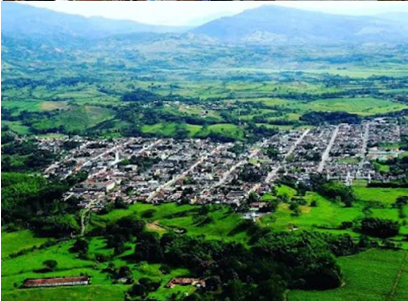
Viterbo desde el aire, en video de Andrés Pangara; y Panorámica de Viterbo en el valle del río Risaralda, en: Página del Municipio.