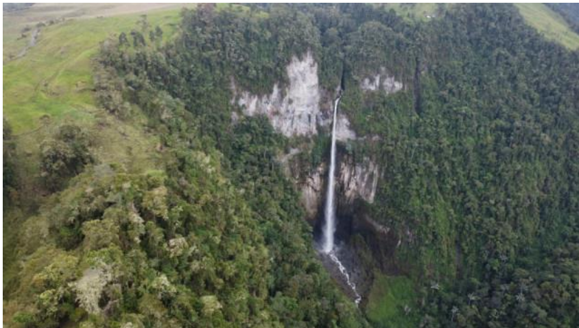
Sectores del Volcán Tesorito-Cerro Gualí y Salto del Salto de la quebrada Nereidas, en La Patria.