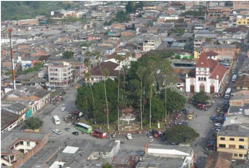
Villamaría: Palacio Municipal y Templo Principal; abajo, Vista aérea del parque principal