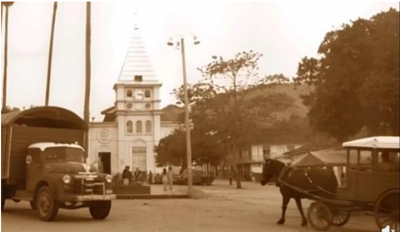
Ferrocarril de Caldas llegando a Villamaría; y Templo de Nuestra Señora del Rosario, antes de 1957 de Nuestra Señora de la Pobreza, en Villamaría.