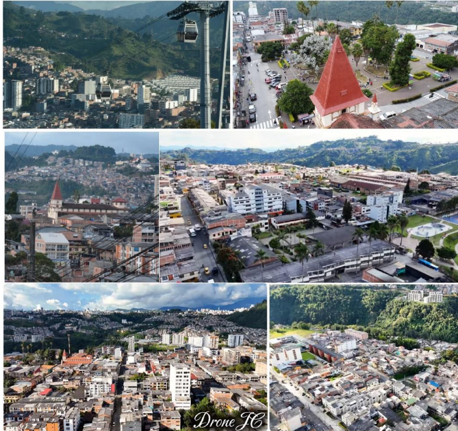
Mosaico de tomas urbanas de Villamaría-Caldas.