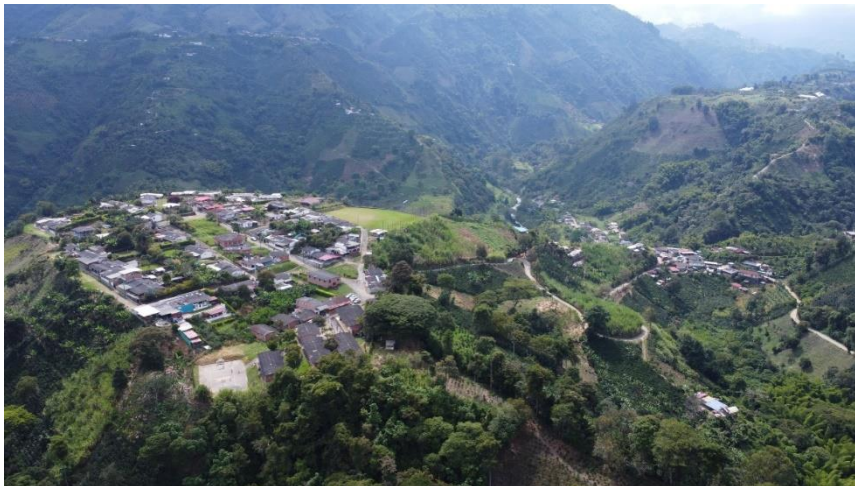
PNN y Volcán Nevado del Ruiz, en Villamaría-Fuente: Rutas del PCC; y Vereda Nuevo Rioclaro, de Villamaría, en La Patria.