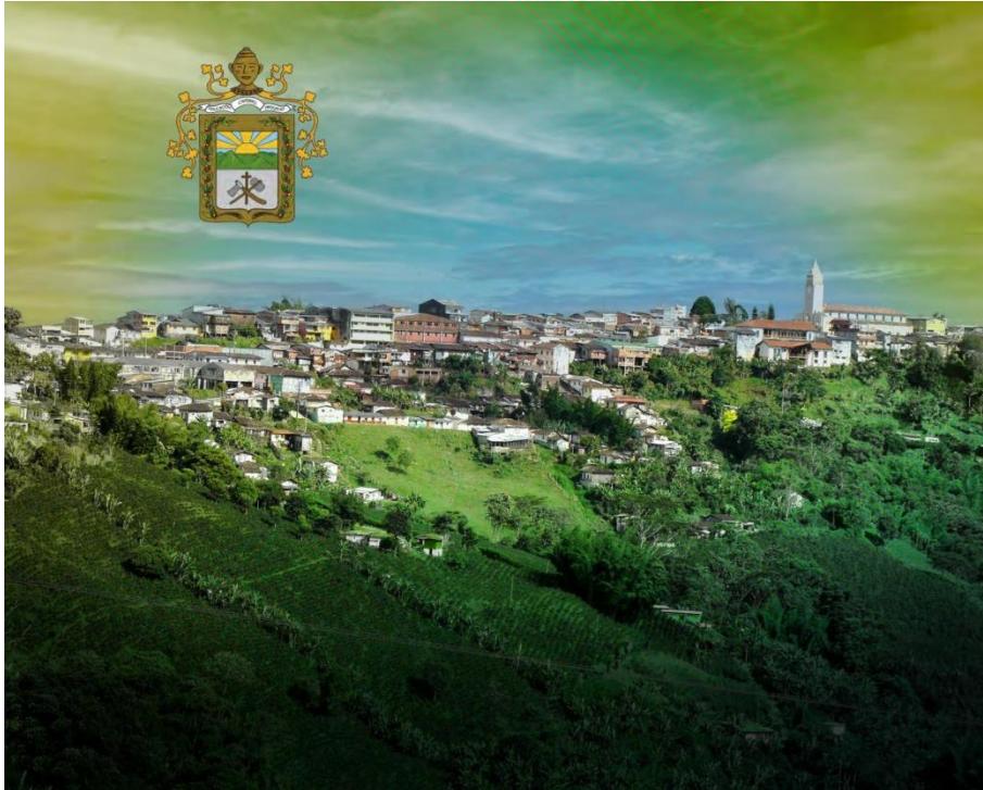
Risaralda-Caldas, la colina del viento.