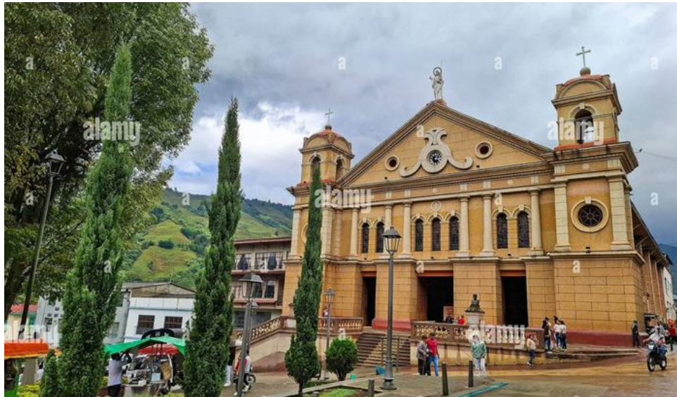
Templo de San José de 1873 en Pácora, una edificación Republicana de estilo románico, con características renacentistas, barroco y colonial.