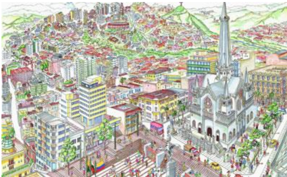
Manizales – Caldas, con la Catedral y la plaza de Bolívar en primer plano, y Sancancio y Palogrande al fondo.

• Así entonces, la nueva infraestructura cultural, deportiva, recreativa y de servicios para potenciar las comunas, reducir la movilidad motorizada y reconstruir el tejido social en el medio urbano más periférico como estrategia de sustentabilidad. Y por supuesto: la educación. Todos estos temas requieren instrumentos de planificación como lo son, además del plan de adaptación al cambio climático, el Plan Maestro que tardíamente se adelanta en el tema de Movilidad y Transporte, o uno de los Planes de Acción Inmediata que oportunamente anticipa Corpocaldas para la difícil problemática de la microcuenca de la quebrada Manizales, donde entre otros asuntos fundamentales propone ordenar bajo la figura de un polígono industrial la actividad productiva de mayor relevancia económica para la ciudad, orientándola hacia la producción limpia y resolviendo sus conflictos de uso del suelo. Si bien la inversión en infraestructura, donde se incluyen la económica y la social, no resulta ser inflacionaria, también se debe tener en cuenta que los instrumentos de planificación tienen la posibilidad de prevenir graves desastros.