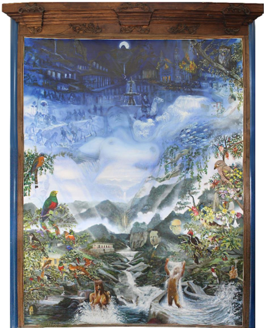
Rio Blanco cuna de vida – Obra de Luis Guillermo Vallejo en AM. Campaña SMP Manizales

• Mientras los problemas de la ciudad se centran en asuntos relacionados con deficiencias estructurales en materia de empleo, pobreza, corrupción, salud y seguridad, sin desconocer la importancia de los avances urbanísticos relacionados con proyectos de la administración pública que han transformando el medio citadino en la última década, continuamos valorando la gestión gubernamental por la magnificencia de las obras de infraestructura, y no por sus impactos desde la perspectiva social, ambiental y económica. En el sumario de los logros, posiblemente, lo económico y lo ambiental pueden salir bien librados en Manizales, pero en el tema social, si la situación no se ha degradado tampoco ha mejorado por diferentes causas, entre ellas factores como la deshumanización de la economía y la visión equivocada de un modelo de desarrollo, donde no se prioriza la formación del capital humano sobre el crecimiento económico, y en consecuencia, donde se desconoce la importancia de la educación como estrategia del desarrollo y de generación de empleo digno y trabajo productivo.