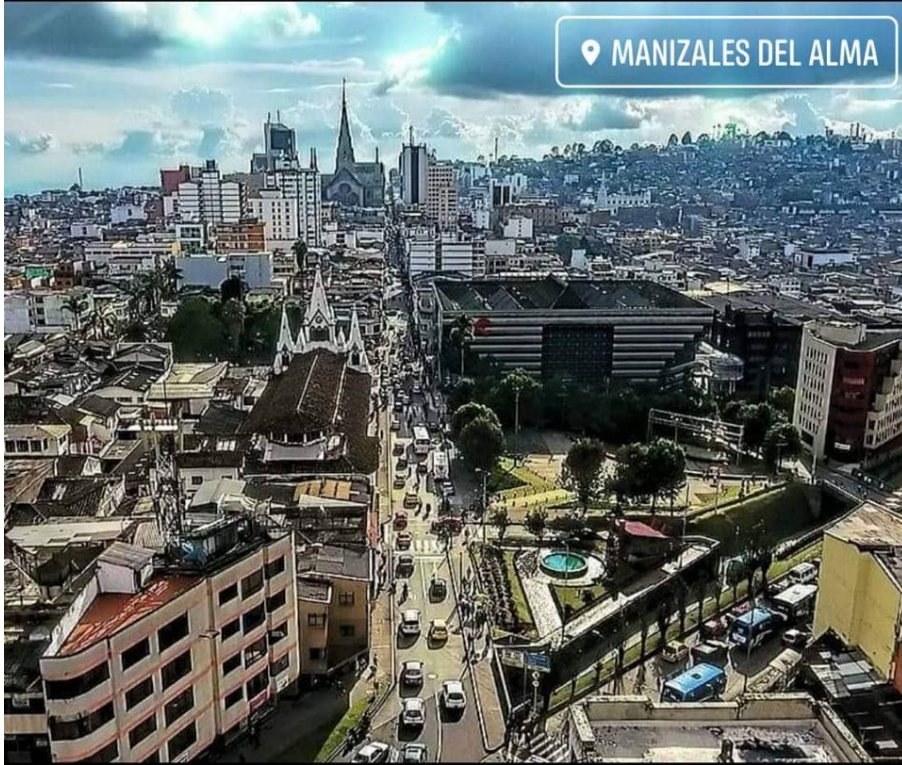
Manizales del alma.

• Todo esto me preocupa por el impacto que pueden tener los desaciertos y controversias de hoy sobre la confianza de los ciudadanos respecto a las potencialidades de Manizales, una ciudad con grandes posibilidades y capacidad de emerger de sus desgracias en virtud del civismo de su gente, como lo ha comprobado su gloriosa historia por más de una vez. Entre estas transformaciones donde se han aplicado recursos significativos del Estado en temas relacionados con movilidad y transporte de forma aleatoria, y en la mitigación del riesgo asociado a fenómenos geodinámicos como consecuencia de imperativos ambientales, para mañana posiblemente las prioridades y nuevos desarrollos en infraestructura estarán asociados a algunos temas complejos y costosos, como son el necesario fortalecimiento del perfil industrial y académico de nuestra ciudad, el saneamiento básico buscando tratar las aguas servidas, la conectividad regional donde entran los medios de transporte por tierra y aire sin los cuales la ciudad no resultará viable, y de no prosperar criterios desarrollistas ya que la idea es avanzar en una ciudad mas incluyente, mas verde y mas humana.