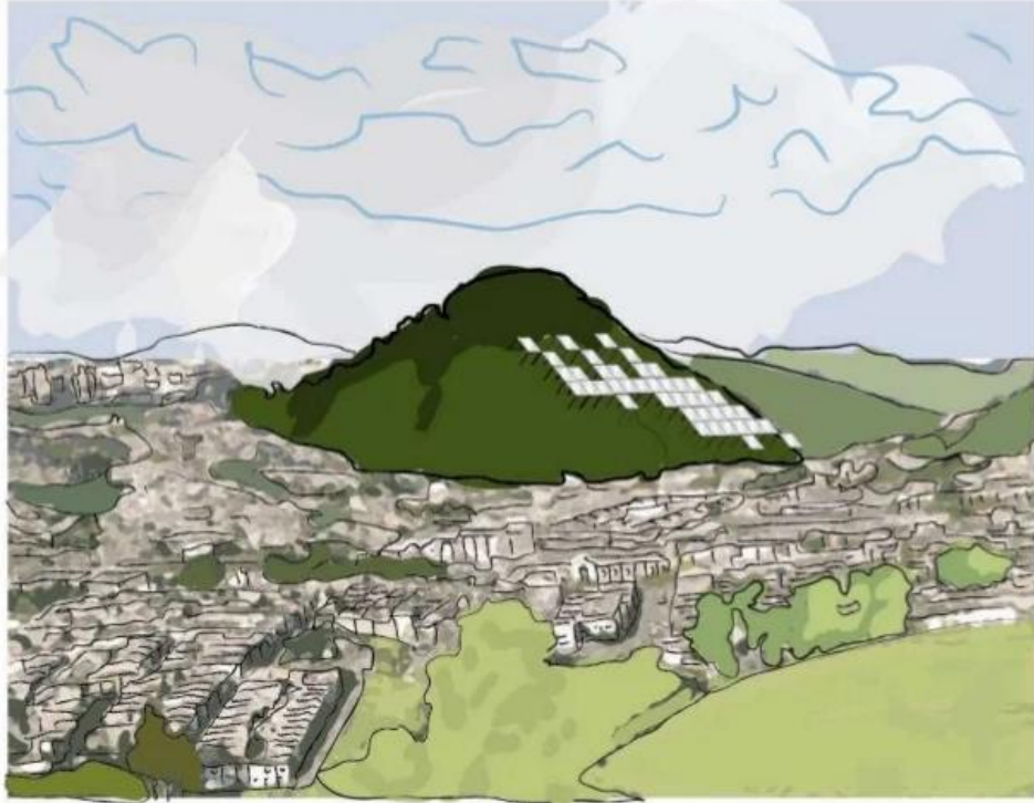
Manizales: Sancancio, el Cerro tutelar de la ciudad, es un otero de origen volcánico.

• Todo lo anterior, es posible siempre y cuando se contemplen procesos de participación ciudadana y de consulta a los actores sociales estratégicos que encuentran espacio en la Ley, necesarias para lograr la apropiación social del territorio, la identidad de Manizales y la solución de los conflictos sociales y ambientales, y para que se tome la región como sujeto de derechos bioculturales y no como objeto de la planeación por parte de quienes especulan con la plusvalía urbana, para no desconocer la cultura y encontrar espacios de interacción y escalas del territorio municipal variadas en sus dimensiones ambientales y diversas en sus contenidos socioculturales. Y hemos hablado de una década porque los POT tienen vigencia de tres períodos constitucionales de alcaldía, y la vigencia del actual concluye con grandes obras, pero para la dimensión social y cultural con más pena que gloria, dada la escasez de las propuestas, la reducida inversión, la flaqueza en los análisis por falta de interés y convicción sobre las problemáticas sociales de la ciudad, donde el olvido y superficialidad de las metas de la educación y la cultura subrayan las contradicciones que van saliendo a flote en ellas.