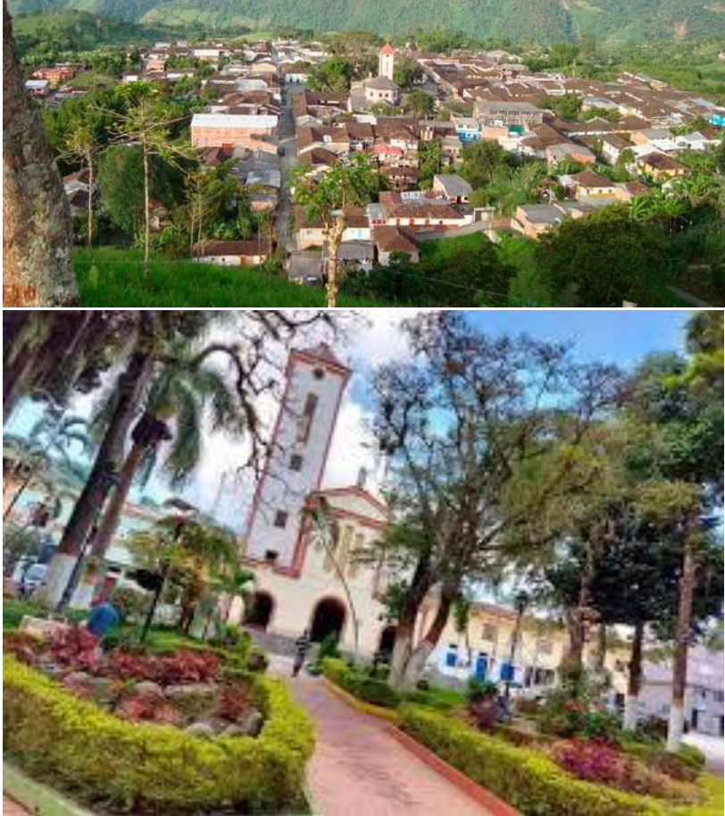
Panorámica de Filadelfia, y vista del Parque y el Templo, en Así es Colombia.