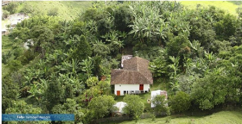
Parapentismo en Filadelfia-Caldas, y un ambiente rural filadelfeño.