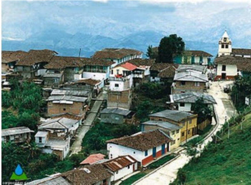
Filadelfia, imagen de un entorno urbano, en Historia y Región.