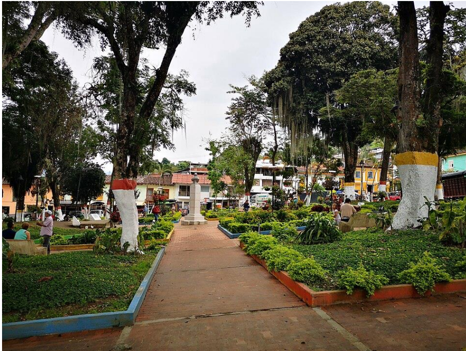
Parque de Filadelfia Caldas