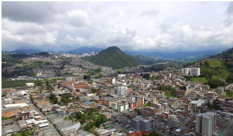
Villamaría- Caldas Parque principal en La Patria; y Panorámica con el Cerro Sancancio al fondo, en Google.com