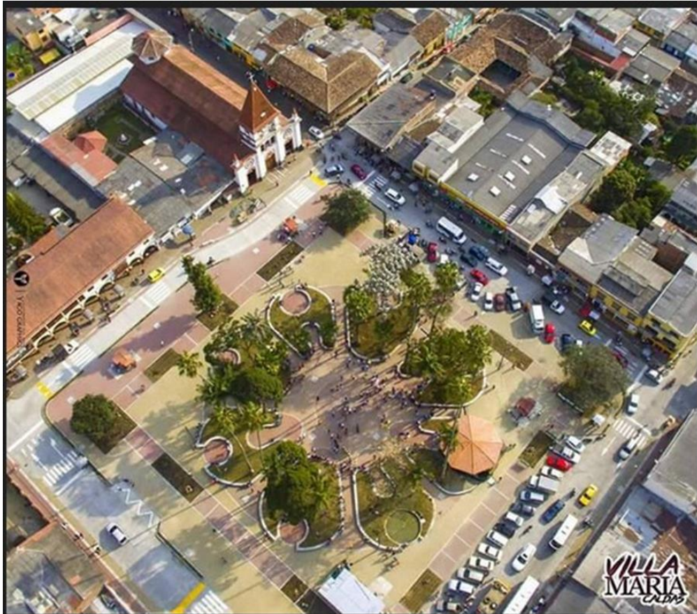
Vista del Parque principal de Villamaría, en Destino Caldas.