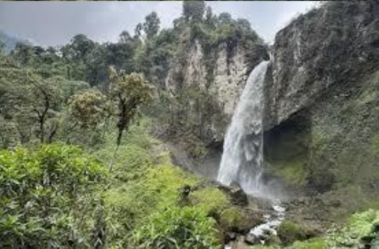
Villamaría: Arriba: Toma aérea de la Cascada Nereidas, en La Patria. Abajo Cascada del Río Molinos.