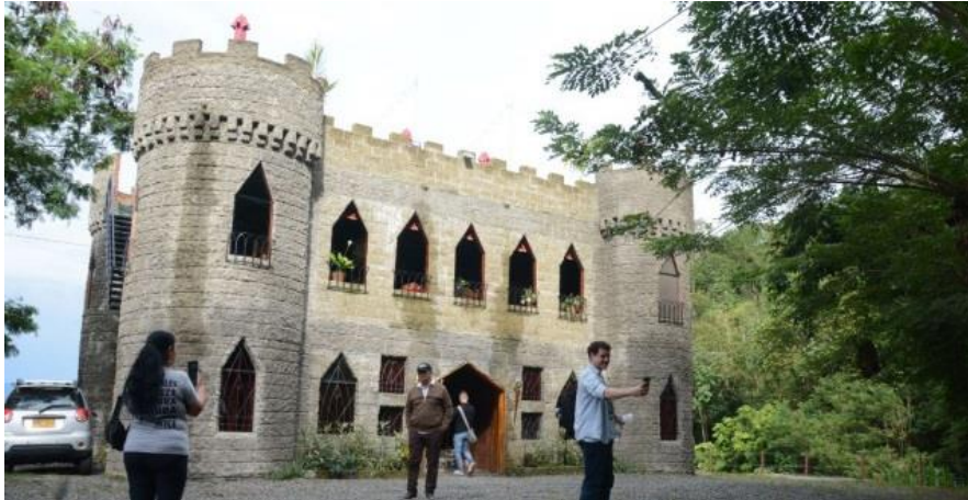
Imagen: Ariba. Sector Sur del área urbana de Belalcázar- Caldas. Abajo. El Castillo Del Café. Sector Rural de Belalcázar.