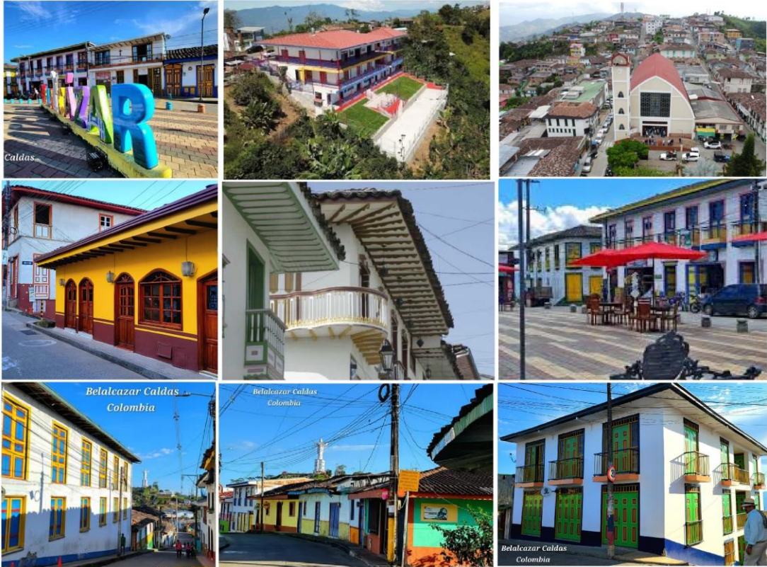
Mosaico de imágenes de Belalcázar, con fotografías de varias fuentes.