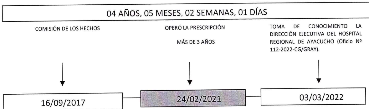
TABLA DE PRESCRIPCIÓN (COMISIÓN DE LOS HECHOS 16 DE SETIEMBRE DEL 2017)

En consecuencia, el 03 de marzo del 2022 2 el Titular de la Entidad (Director Ejecutivo del Hospital de Ayacucho), mediante Oficio N° 000112-2022-CG/GRAY, tuvo conocimiento del Informe de Control Especifico N° 065-2022-CG/GRAY-SCE, cuando había transcurrido más de tres (03) años , desde la comisión de la presunta falta; por lo tanto, la facultad del Estado para determinar la existencia de infracciones administrativas se extinguió por el transcurso del tiempo, generando la prescripción por la inacción administrativa.