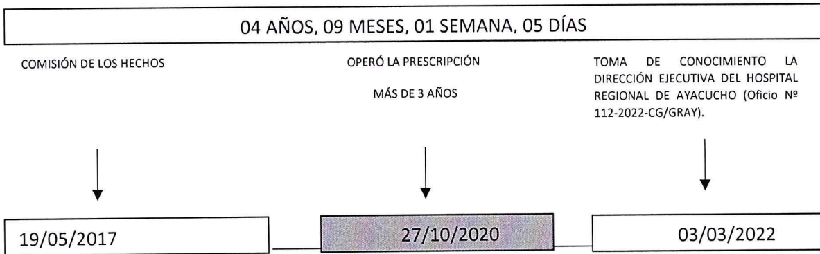
TABLA DE PRESCRIPCIÓN (COMISIÓN DE LOS HECHOS 19 DE MAYO DE 2017)