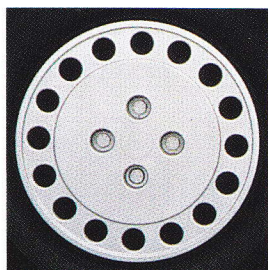
Uno Turbo D.