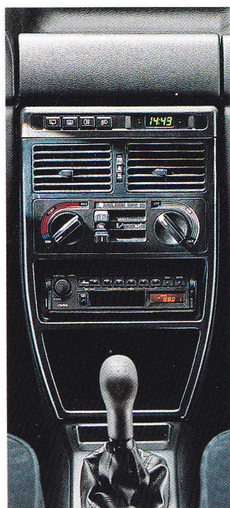
Élégante console centrale, court levier de vitesse de type sport.

sollicitation 71 chevaux. 170 ou 165 km/h sur circuit, reprises de haut niveau, sobriété exemplaire: les Uno 70 SX i.e. et Turbo Diesel vous font gagner sur tous les tableaux. Et c'est par un véritable festival d'équipements qu'elles terminent de se présenter.