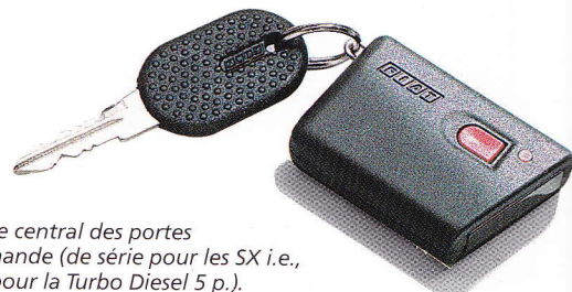
Verrouillage central des portes à télécommande (de série pour les SX i.e., en option pour la Turbo Diesel 5 p.).