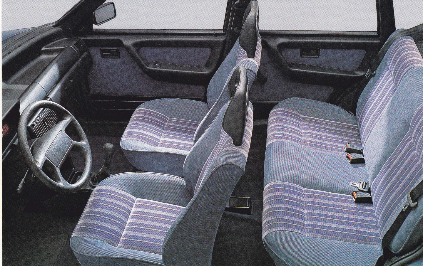
Un luxueux velours habille les sièges et les contreforts des portières.