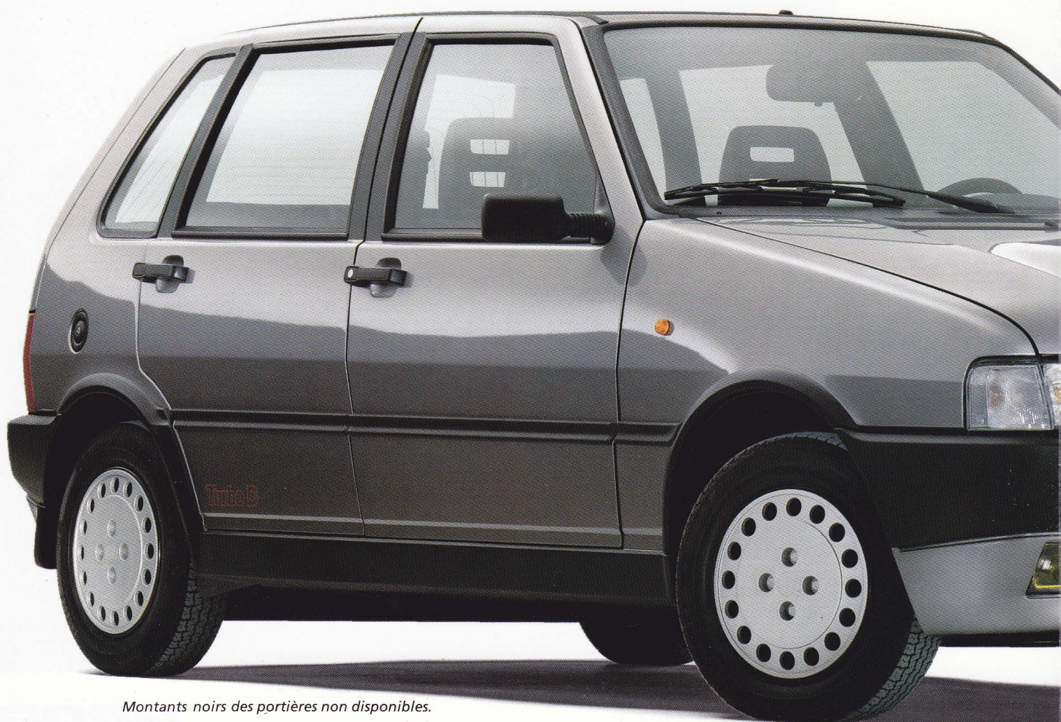
Montants noirs des portières non disponibles.