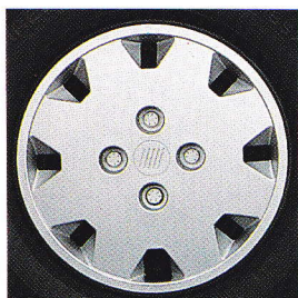
Uno 70 SX i.e.