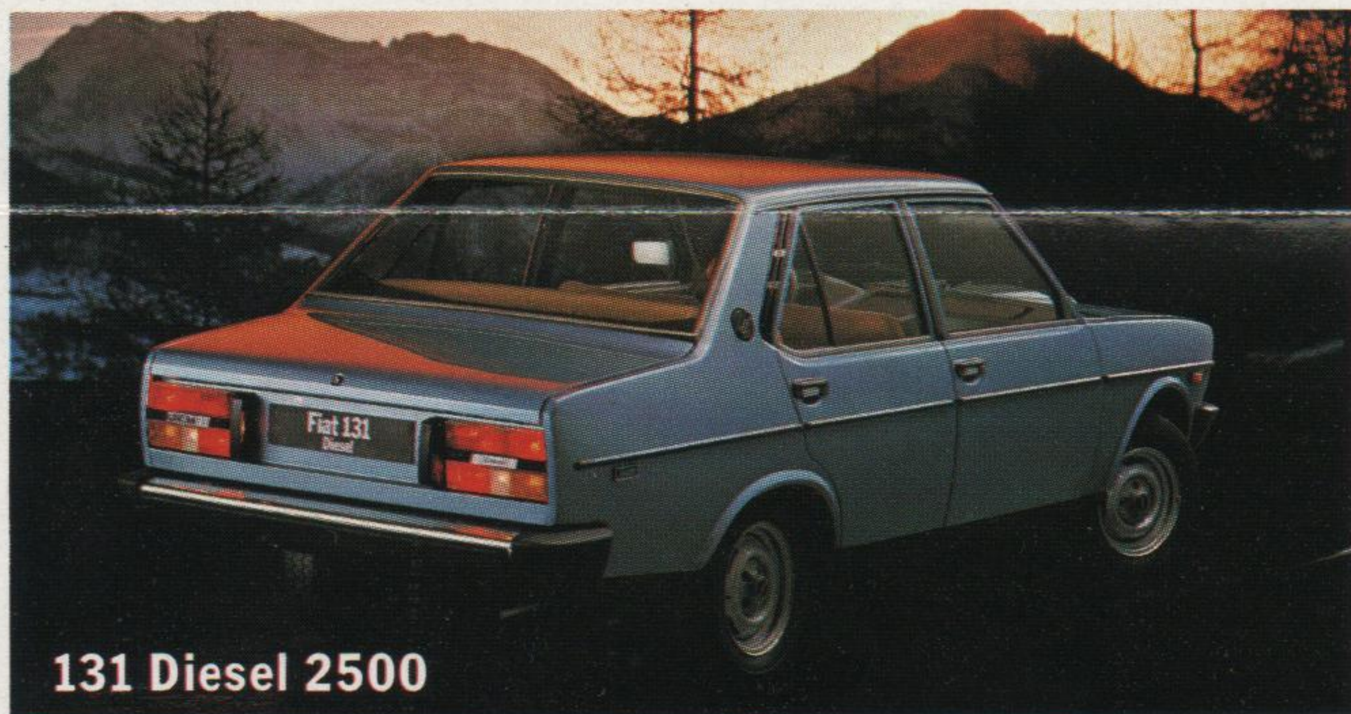
131 Diesel 2500

Boîte de vitesses à 5 rapports et marche AR. Levier de commande au plancher.