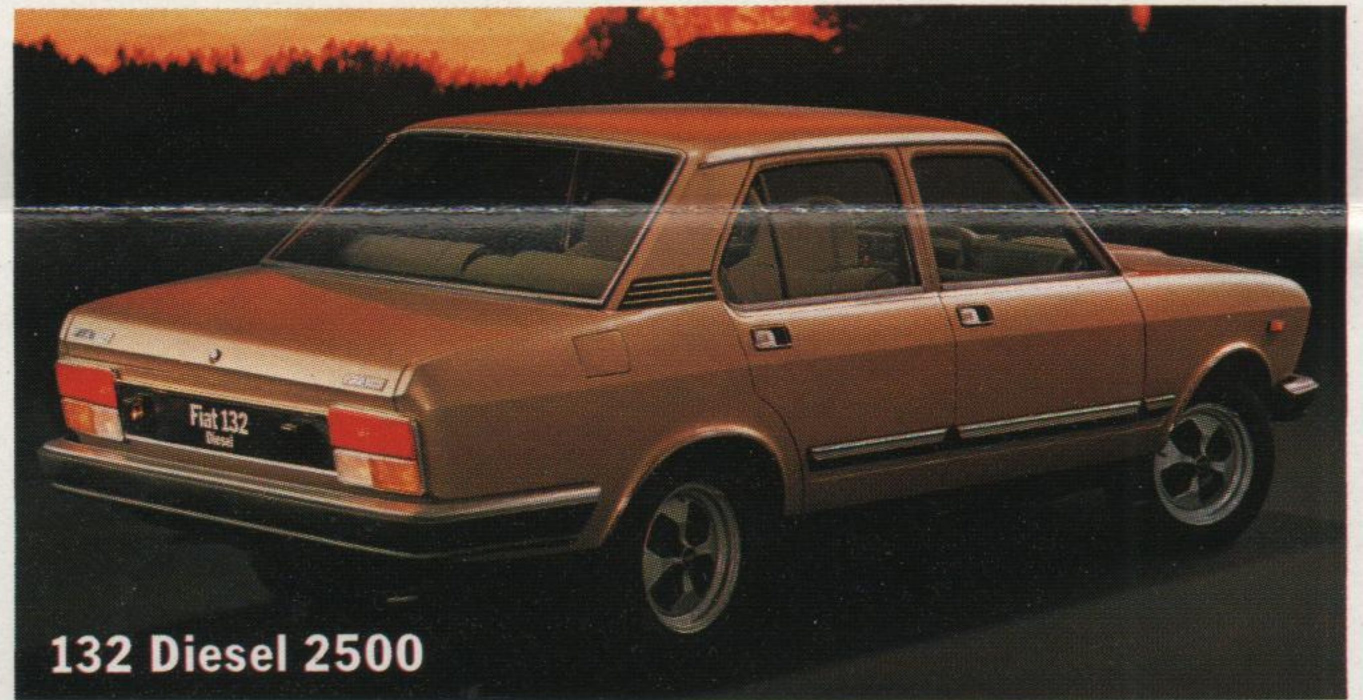
132 Diesel 2500

Option : peinture métallisée sur la Supermirafiori.