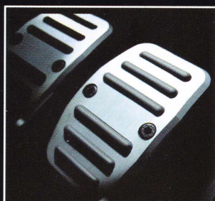
Pédalier Aluminium Sportif