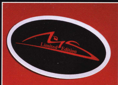
Logo Série Limitée