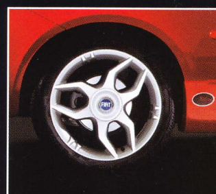
Jantes Alliage de 17 ''