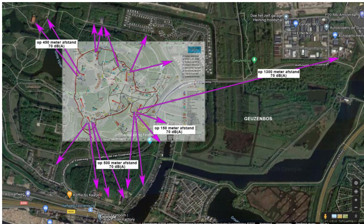
Het evenemententerrein met de area's van Awakenings 2019

Bij gebrek aan een dichtbijgelegen woning dient de gemeente deze overmaat aan geluidsbelasting simpelweg te voorkomen met een referentiemeetpunt op 250 meter afstand van het akoestisch centrum van de bron, op basis van de geldende gevelnorm, als onderdeel van de eerdergenoemde continue meetpunten. De exacte locatie dient in de beleidsregel vastgelegd te worden als permanente meetlocatie in overleg met de bewoners. Het festival moet hiermee om kunnen gaan, het lukt ook in de andere windrichtingen waar wel dichtbijgelegen woningen zijn.