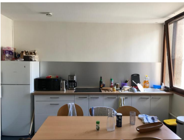
La cuisine du foyer