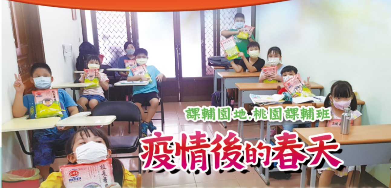
課輔園地.桃園課輔班