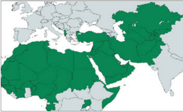
الخريطة (2): العالم الإسلامي البري

لكن نظرية حمدان -على وجاهتها وريادتها- يشوّش عليها الانقطاع الكبير داخل هذا الهلال الإسلامي، بسبب وجود بلدان أخرى داخله ليست منه، منها دول ضخمة كالهند والصين، وهذا ليس بالانقطاع السهل. ولذلك فنحن نقترح تصوراً أكثر واقعية وملاءمة للجغرافيا السياسية الإسلامية، وهو تقسيم العالم الإسلامي جغرافياً إلى عالمين: العالم الإسلامي البري، والعالم الإسلامي البحري.