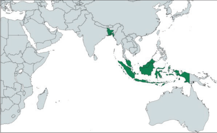
الخريطة (3): العالم الإسلامي البحري

ويبقى أن نبيّن أن الجناح الآسيوي من العالم الإسلامي أضخم جغرافياً وسكانياً من الجناح الإفريقي، وإن كانت نسبة المسلمين من مجموع سكان القارة الإفريقية أكبر. وكما لاحظ جمال حمدان فإن "الجناح الإفريقي لا يقاس البتّة وزناً وثقلاً بالجناح الآسيوي" (76). ومثله مالك بن نبي الذي لاحظ انزياح الإسلام شرقاً (77)، وانتقال مركز ثقله البشري إلى آسيا (78)، وسنعود إلى كلام مالك فيما بعد، ضمن الحديث عن مركز الثقل الإسلامي في العصر الحديث. ولعل ضخامة الجناح الآسيوي من الإسلام، مقارنة مع جناحه الإفريقي، هو ما أغرى محبوباني باعتبار العالم الإسلامي مكوناً من مكونات الظاهرة الآسيوية، كما بيّناه سلفاً.