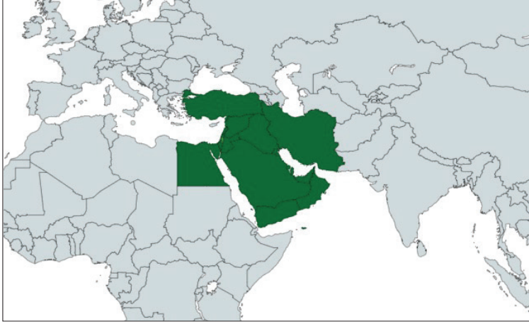
الخريطة (4): إقليم الشرق الأوسط