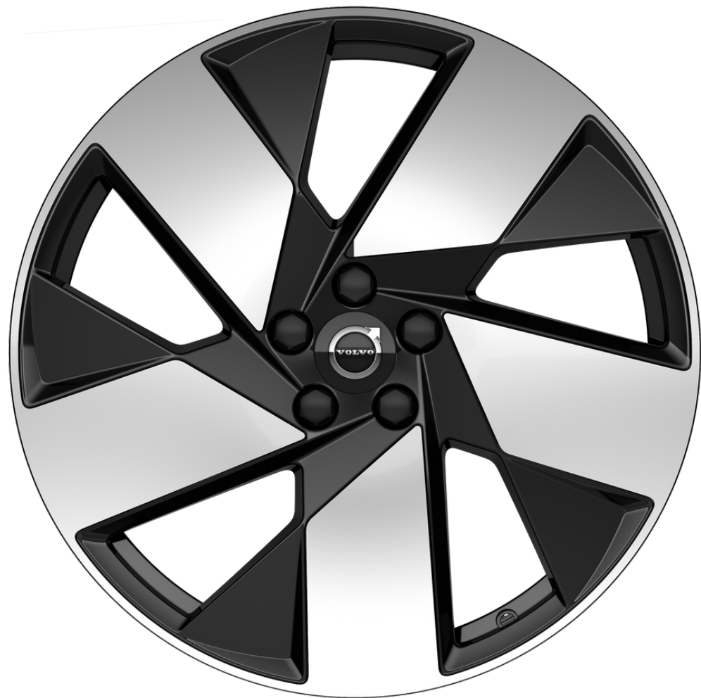
Rodas de liga leve 20"