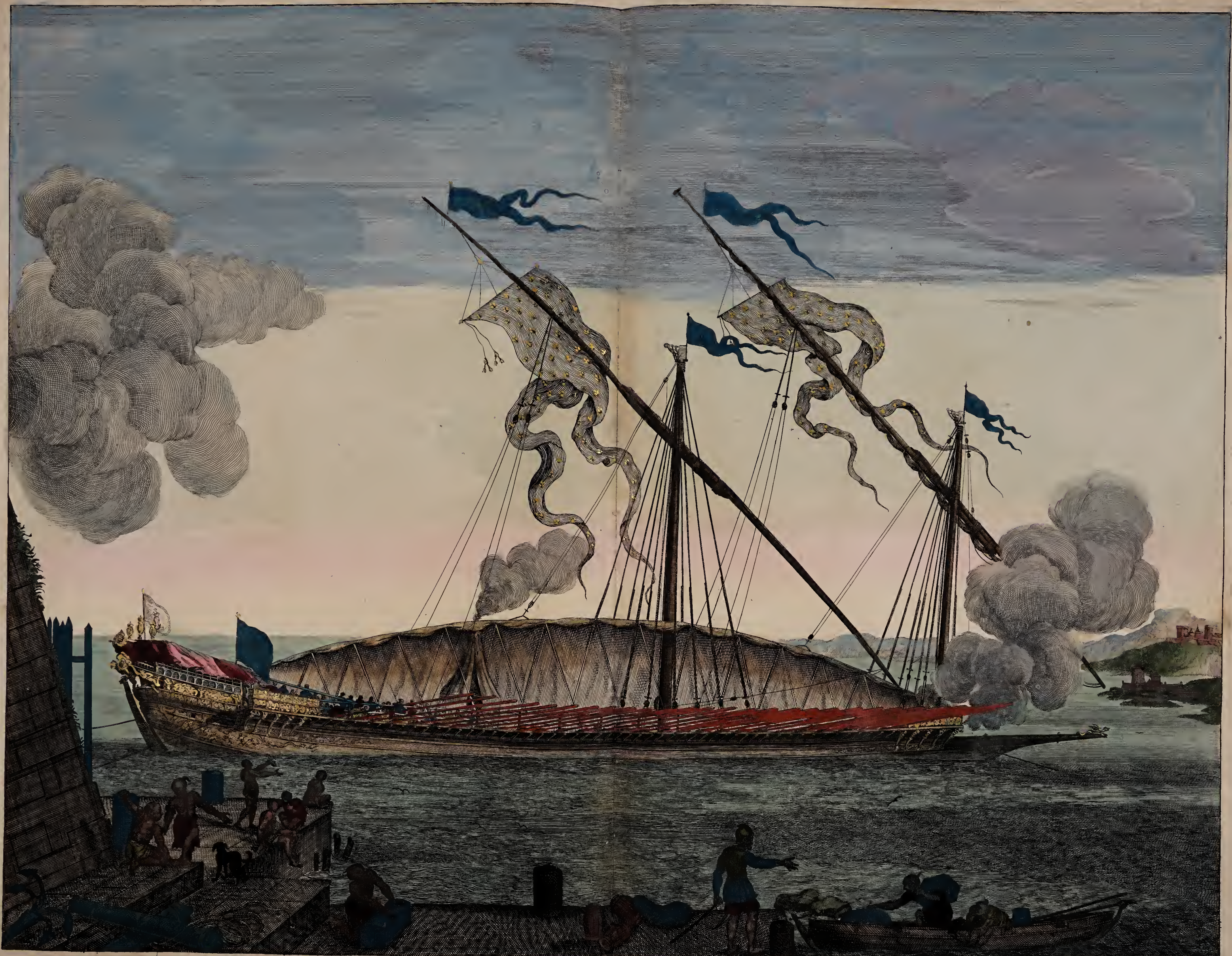
la Galere Reale a la sonde.