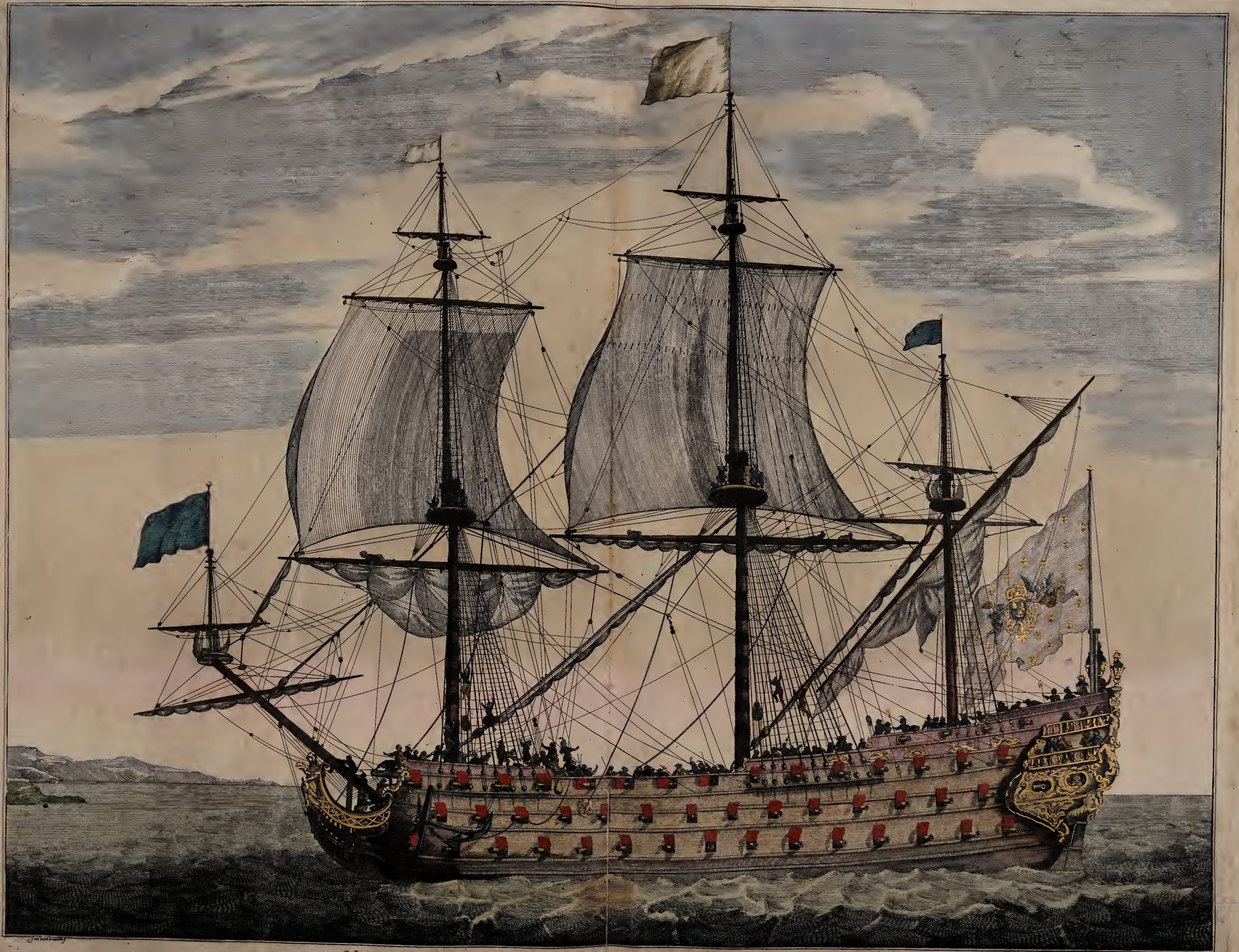
Vaisseau du premier rang portant pavillon d'Admiral