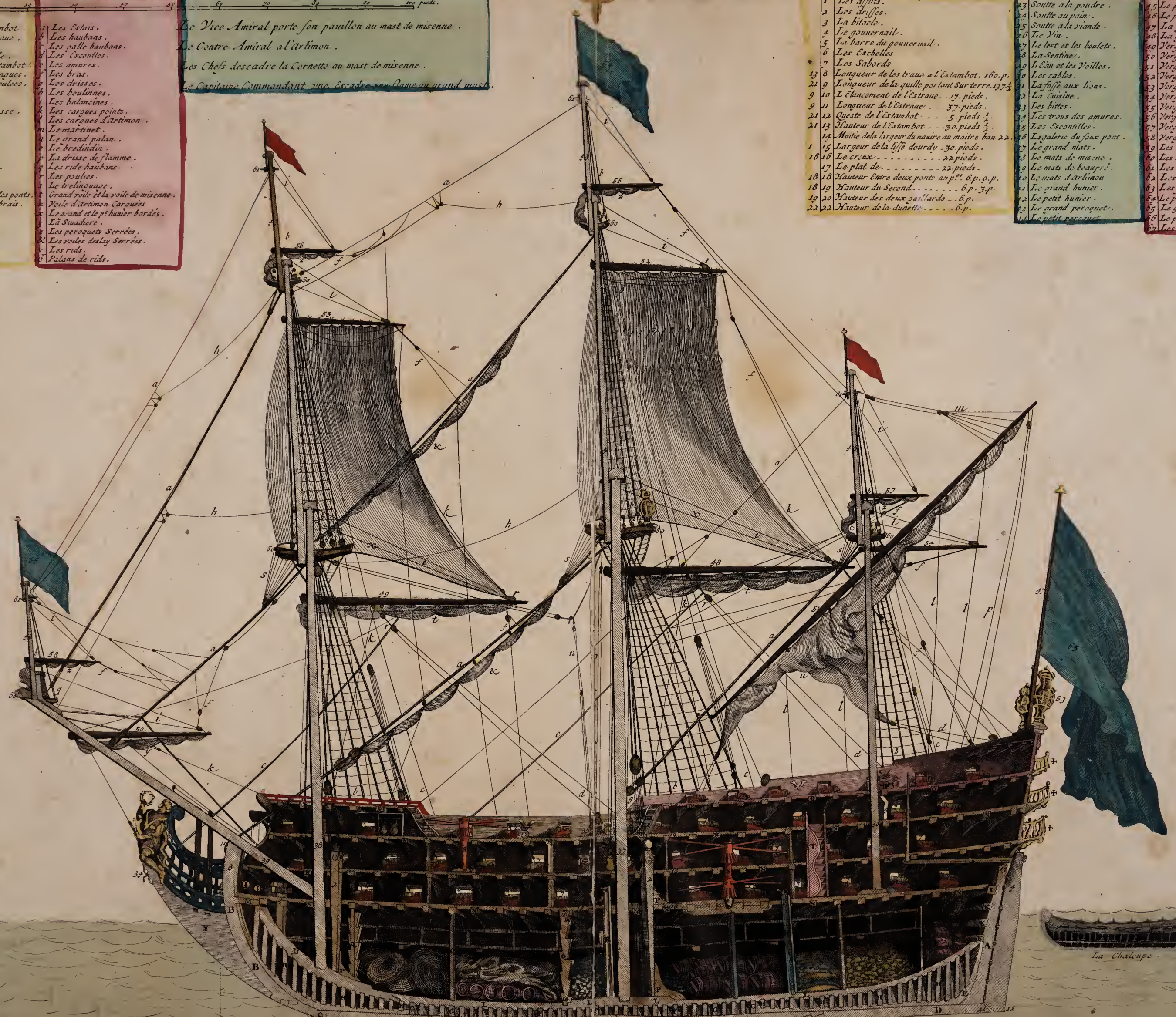
Coupe dun Amiral de 104. piéces de Canon avec ses principales proportions et les noms des piéces du dedans .