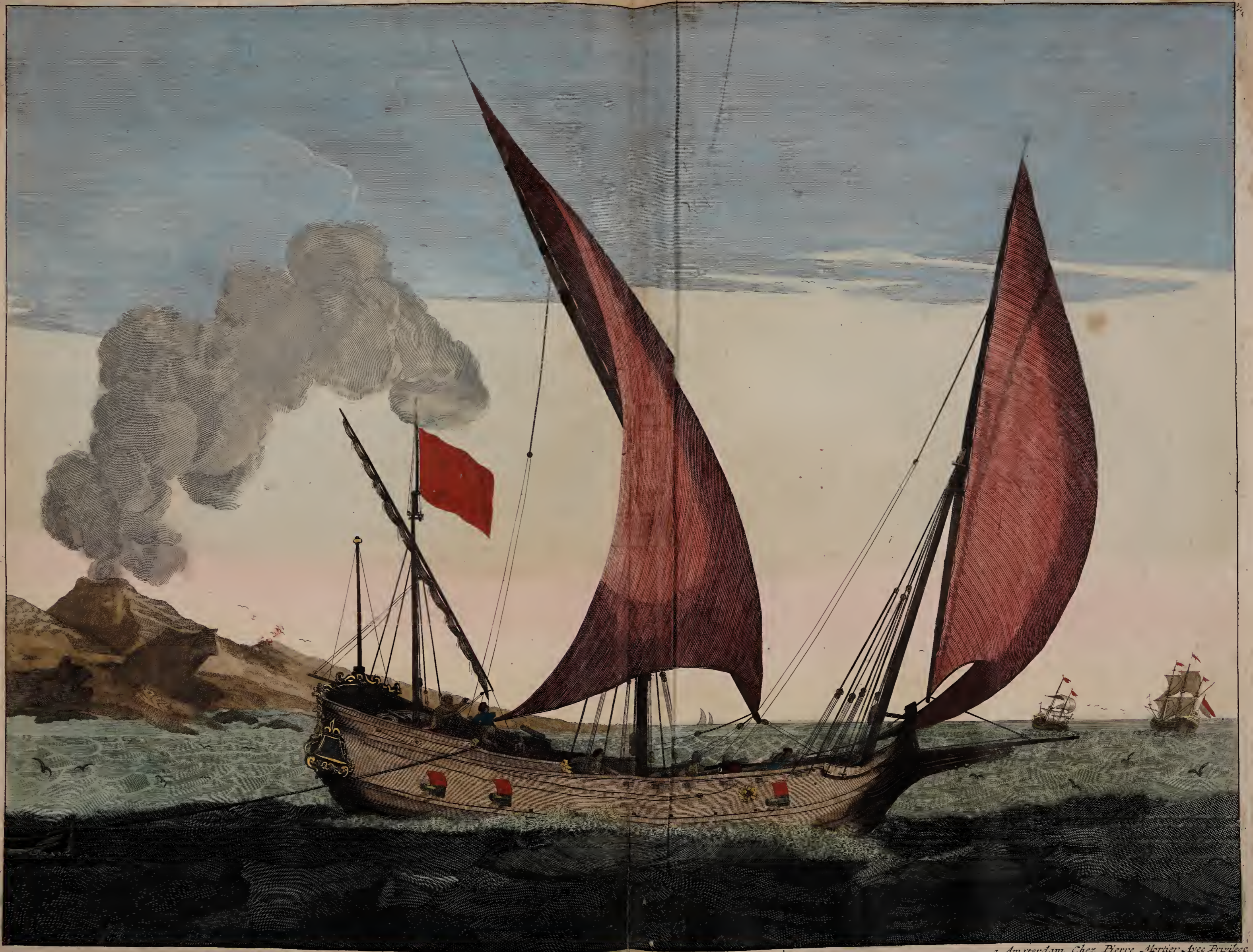
Barque allant vent arriere.