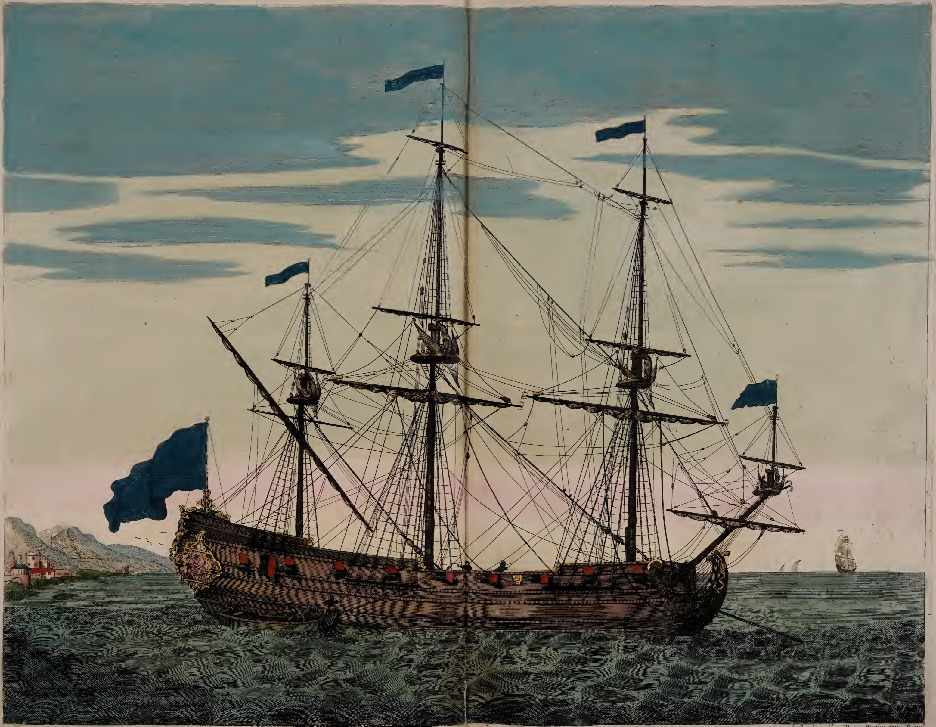
Bruster a la Sonde