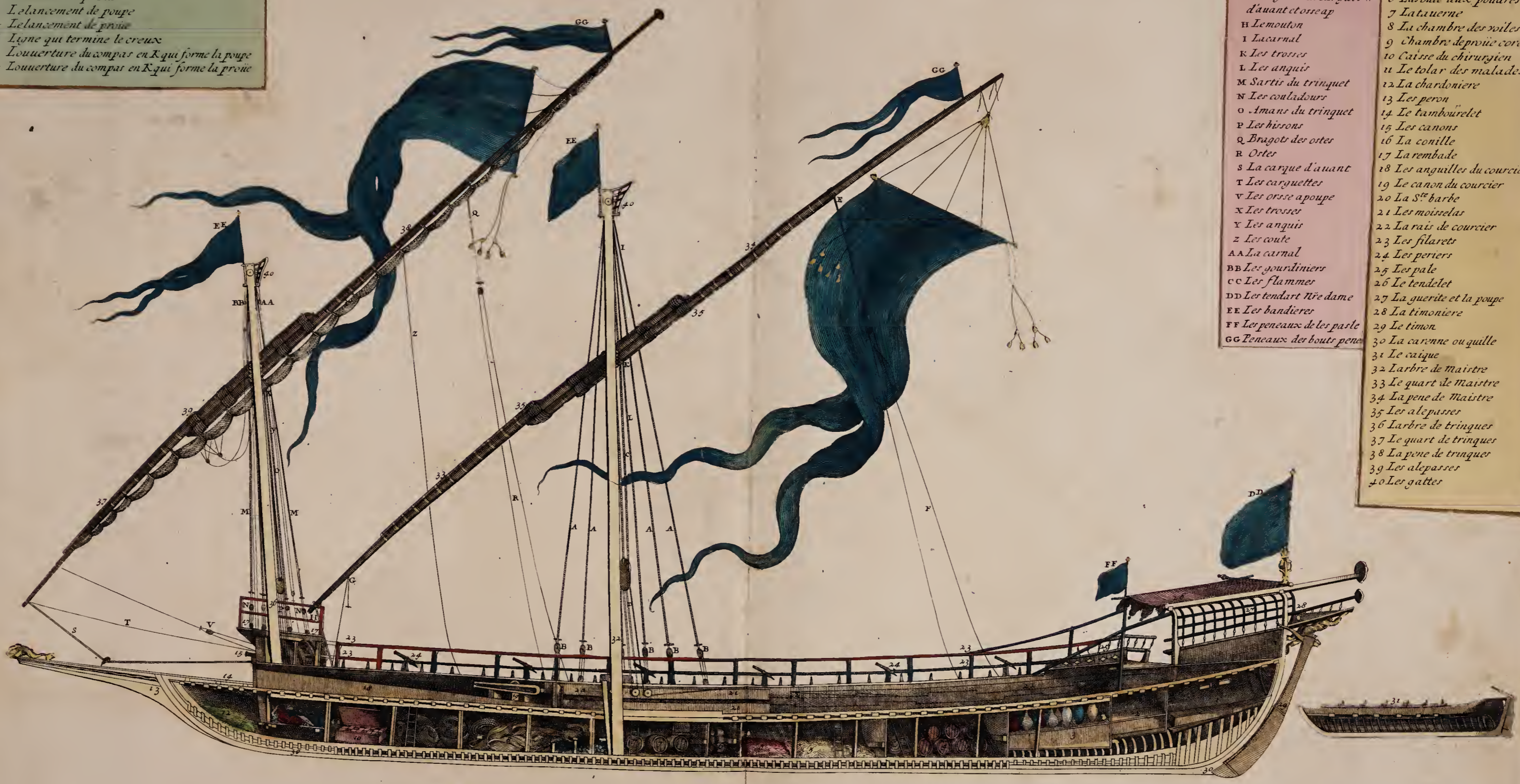
Coupe D'une Galere Avec Ses Proportions