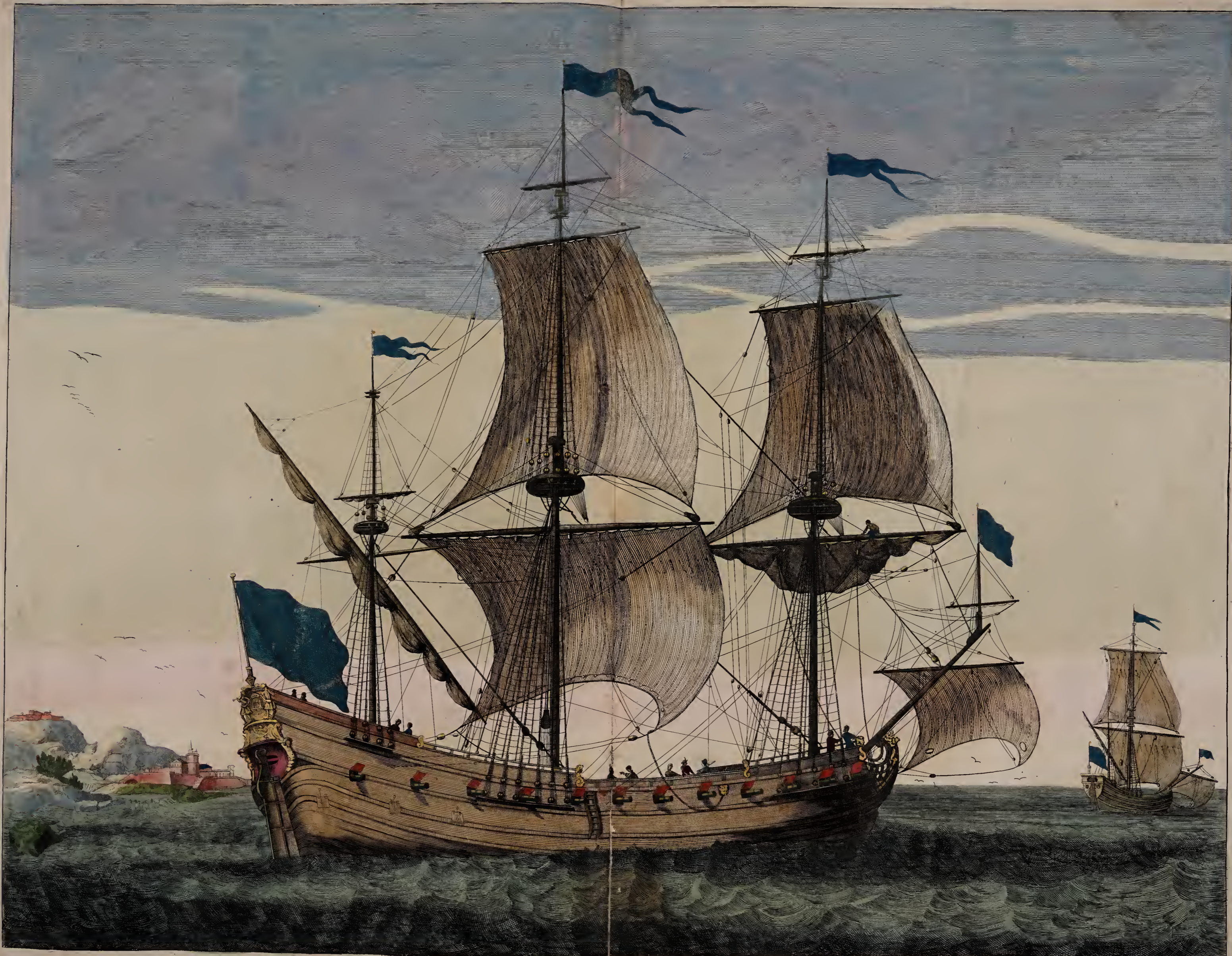
Flute Vaisseau de charge a la voile . Koopvaardy Fluydt.

A Amsterdam Chez Pierre Mortier Avec Privilège